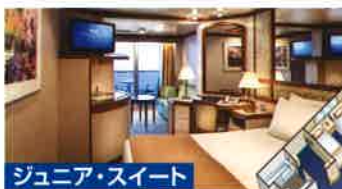
ジュニア・スイート