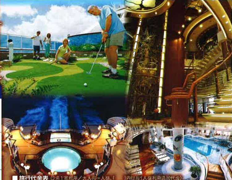
■旅行代金表 (2名1室利用/大人一人様、[ ]内は1人様利用追加料金)