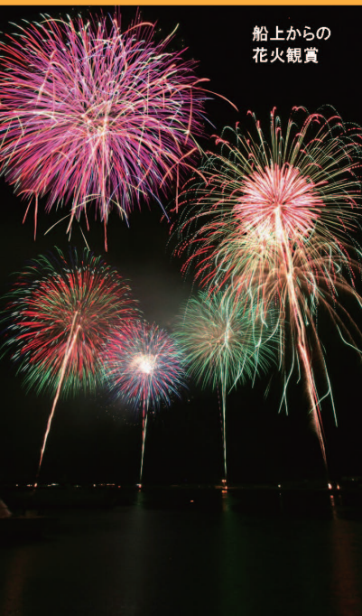
船上からの 花火観賞