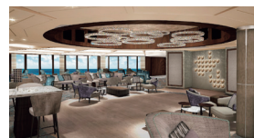
バーやラウンジも華麗に変身。くつろぎのひとつをお過ごしください。