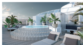
スイート客室専用のオープンデッキ「ザリトリート」を新設。