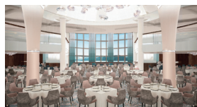
白を基調としたエレガントなメインダイニングでフルコースを。