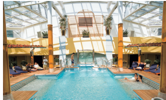
海水を使ったプール&ジャグジーはタラソテラピー効果抜群。