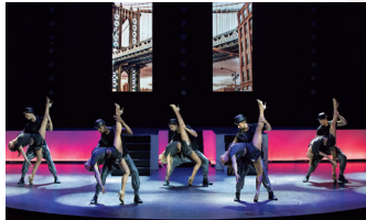
大型シアターで鑑賞する、珠玉のエンターテインメント。