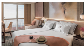
客室のデザインを一新。よりスタイリッシュな空間に生まれ変わりました。