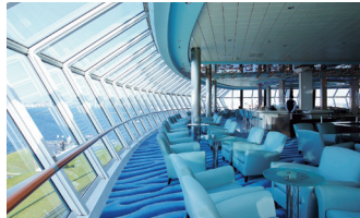
著名な建築家達が手がけたスタイリッシュな空間デザイン。