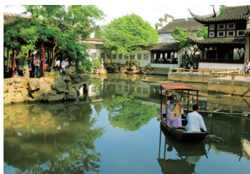
水の都蘇州(イメージ)

新しい摩天楼が立ち並ぶ浦東新区、そのエキゾチックでダイナミックな景観が楽しめる対岸に停泊します。高層ビル上階から街並みを俯瞰し躍動感を味わい、多くのレストランやギャラリーが集まる外灘地区の歴史的建造物を訪ね、昔ながらの飲食店で現地の人にも大人気の上海蟹を味わうなど、新旧の魅了が交錯する大都会を体感する2日間です。また、「東洋のベニス」と称される蘇州まで足を延ばし、悠久の歴史に触れてみてはいかがでしょうか。