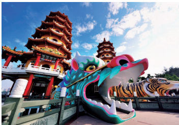
台湾有数のパワースポット龍虎塔