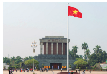
ハノイのランドマーク、ホーチミン廟へ

北ベトナム観光に最適なハイフォンに初寄港します。高速道路の整備により、政治と文化の都である首都ハノイまでは車で2時間。11世紀に都が置かれて以来栄え続ける旧市街、フランス統治時代の歴史的な建造物などエキゾチックな街の風景は必見です。一方で世界遺産に認定されている名勝ハロン湾も見逃せません。大小3,000もの奇岩、島々が存在する海域を小型船で巡り、「世界でここにしかない」といわれる景観を堪能することもお勧めです。