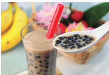
黒糖を練り込んだタピオカは台湾スイーツの代表格