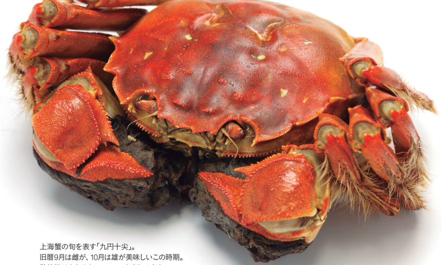
上海蟹の旬を表す「九円十尖」。旧暦9月は雌が、10月は雄が美味しいこの時期。散策時はもちろん、ツアーでも楽しめます。