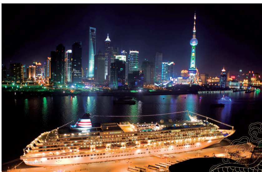
2008年、飛鳥II上海寄港の様子。この時点では上海タワーはまだなく約10年の間に街のスカイラインは大きく変貌した。