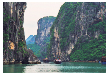
ゆったり時が流れるハロン湾(イメージ)