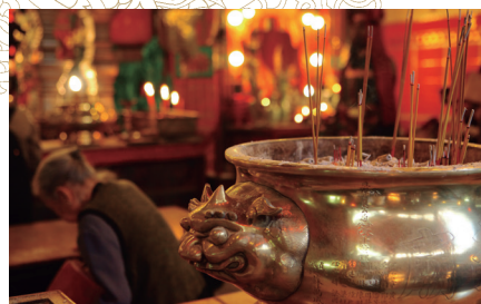
香港の街角で訪れた名もない道教寺院。街は変貌するか人々の日常は変わらない。そんなほっとする光景に出会うのもアジアの魅力。

豊かな6都市を、船旅ならではのコンパクトな日程で巡る充実の20日間。アジアを深く快適に旅する贅沢な時間を、この秋、飛鳥IIで。