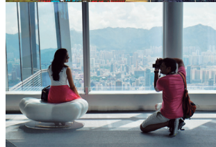
上：左からワールドフィナンシャルセンター、ジンマオタワー、そして上海タワー。それぞれ世界第13位、28位、2位の高さを誇る。 中：香港1高層の世界貿易センター100階にある展望台。 眼下に九龍市街からビクトリア湾、香港島を臨む新しい観光スポット。 下：高層建築のみならずアートを軸とした街の開発が進むアジア。高雄では港湾部に広がる倉庫街がモダンなアートスポットに。