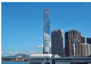
港から見上げる香港世界貿易センター

さらなる開発が加速する香港。注目は2010年に完成した118階建ての世界貿易センター。100階にある展望台からは足元の九龍地区の旧市街からビクトリア湾、香港島に広がる再開発の息吹を感じることができます。世界のハイブランドのブティック巡りはもちろん、デザインや味が斬新な新飲茶体験、レトロスタイルのトラムでの市内観光など思い思いに楽しめる香港。散策に最適な九龍地区のオーシャンターミナルに着岸するのもポイントです。