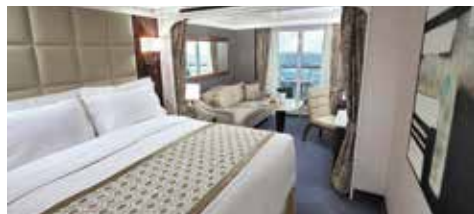
F / デラックスベランダスイート (33m 2 )