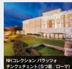
NHコレクション パラッツォ チンケチェント (5つ星 / ローマ)