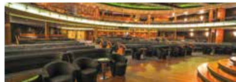
コンステレーション シアター

世界で最もラグジュアリーな客船のひとつ、セブンスーズ・ボイジャーは、一般的なクルーズでは有料であるスペシャリティレストランの利用料、船内でのチップ、wi-fi接続料、高級なワインやスピリッツ、さらに寄港地観光に至るまで代金に含まれる真のオールインクルーシブ・サービスを提供します。