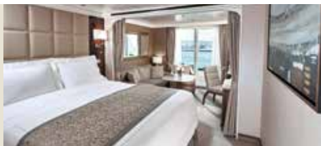
C / ペントハウススイート (36m 2 ~41m 2 )