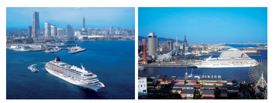
横浜港の飛鳥IIイメージ 神戸港の飛鳥IIイメージ