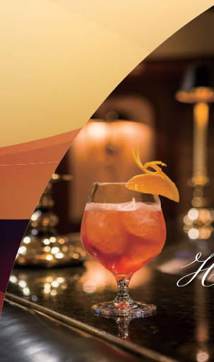
Hiromi Iwasaki Special Stage