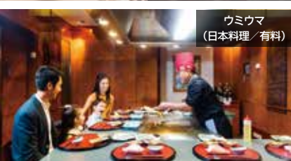
ウミウマ (日本料理/有料)