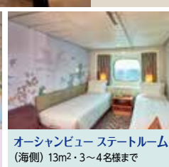
オーシャンビュー ステートルーム (海側) 13m 2 ・3~4名様まで