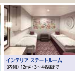
インテリア ステートルーム (内側) 12m 2 ・3~4名様まで