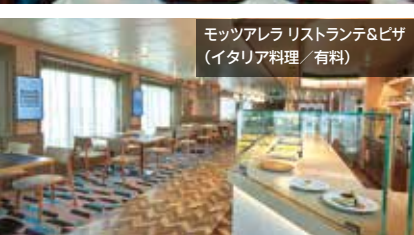
モッツアレラ レストラン&ピザ (イタリア料理/有料)