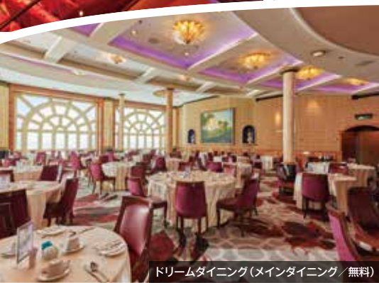
ドリームダイニング(メインダイニング/無料)