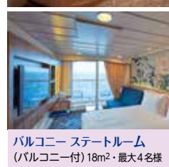
バルコニー ステートルーム (バルコニー付) 18m 2 ・最大4名様

*24時間対応のバトラーサービス*レストラン・スパ・プール等のプライベートエリア利用*パレス専用レストラン*バーレストランのプレミアムドリンクパッケージ(一部除く)*WiFi標準パッケージ*ソフィアックシアター*ショー鑑賞の優先席*ウェルカムミニバー等