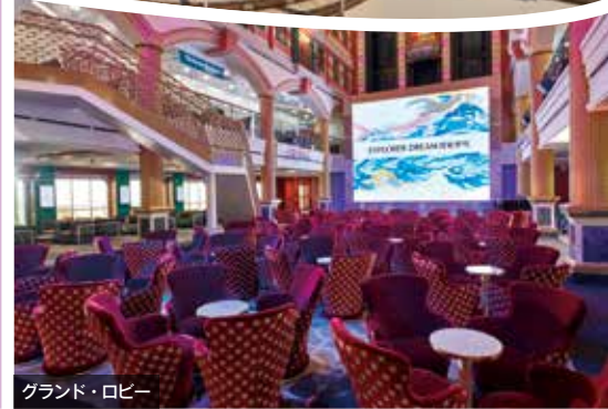
グランド・ロビー

エクスプローラー・ドリームは、クルーズの新しいスタイルの客船として2019年にデビューしました。アジア太平洋地域で最速を誇るこの客船は、アジアやイタリアなどのヨーロッパのテイストが融合したインテリアで統一されています。ワールドクラスのエンターテインメント・ショー、多彩なアクティビティ、船内15のレストラン&バーでは受賞歴のあるアジア料理など世界の味覚をお楽しみいただけます。