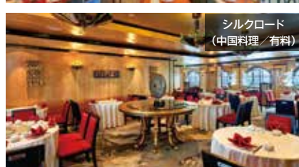
シルクロード (中国料理/有料)