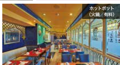
ホットポット (火鍋/有料)