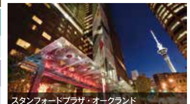
スタンフォードプラザ・オーケランド