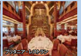
ブリタニア・レストラン