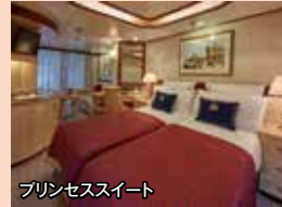
プリンセススイート