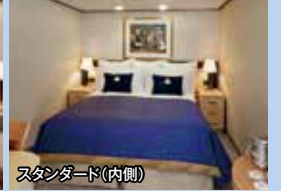
スタンダード(内側)

※ベッドはツインに変更できます。 ※ブリタニア・レストランのみ夕食は1回目(18:00～)と2回目(20:30～)指定の2回制です。