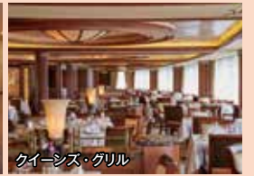
クイーンズ・グリル