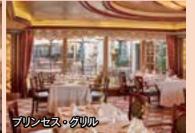
プリンセス・グリル