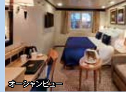
オーシャンビュー