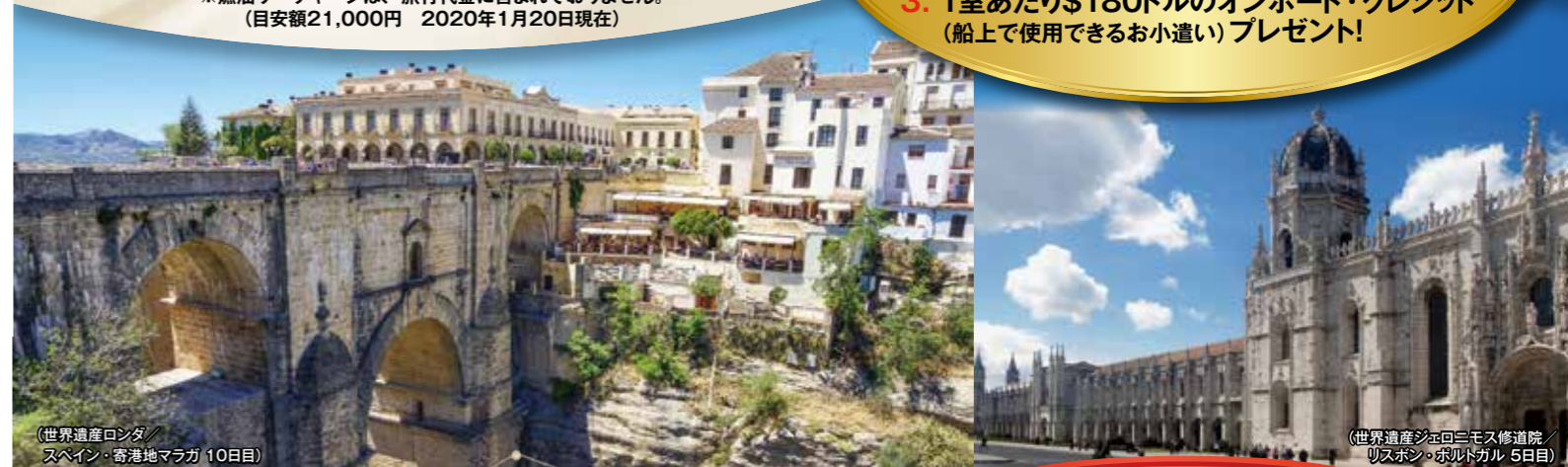
(世界遺産ロンドン/スペイン・寄港地マラガ 10日目)