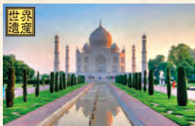
インド・タージマハルの旅