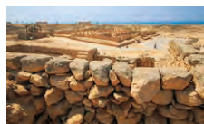
アルバリード遺跡

インド洋を西に進みアラビア半島へ。景色は一転アラビアンナイトの世界に。スーク(市場)で、乳香やこの土地ならではの品をみつけるのも楽しみです。海に面したアルバリード遺跡では実際に乳香の木をご覧いただくことも。