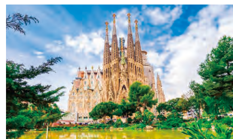
サグラダファミリア