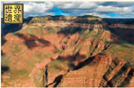
グランドキャニオンの旅