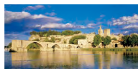
アヴィニョンのサン・ベネゼ橋

フランス最大の港町で南仏の中心地。歴史あるアヴィニオンやプロヴァンスの村々の散策もおすすめです。