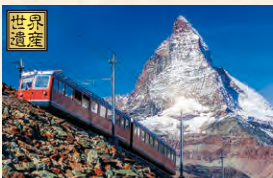
スイス2大名峰と氷河特急の旅