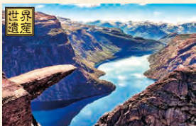
ノルウェー・フィヨルドとフロム鉄道