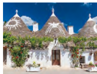
アルペロベッロのトウルリ