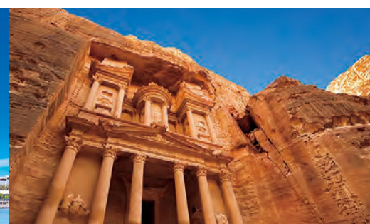
ペトラ遺跡 (アカバ)