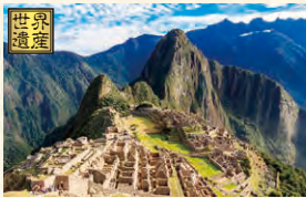
マチュピチュ遺跡とナスカの地上絵