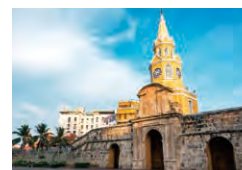
カルタヘナ旧市街