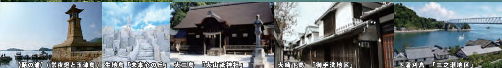
【鞆の浦】(常夜燈と玉津島)