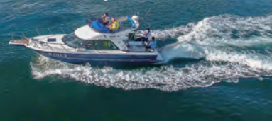
尾道水道と尾道大橋

Carib II プライベートなチャータークルーザーで瀬戸内海の絶景「多島美」をご堪能ください。(エアコン・トイレ付) 定員12名、全長9.22m、全幅2.97m http://takeharamarine.com/cruising/