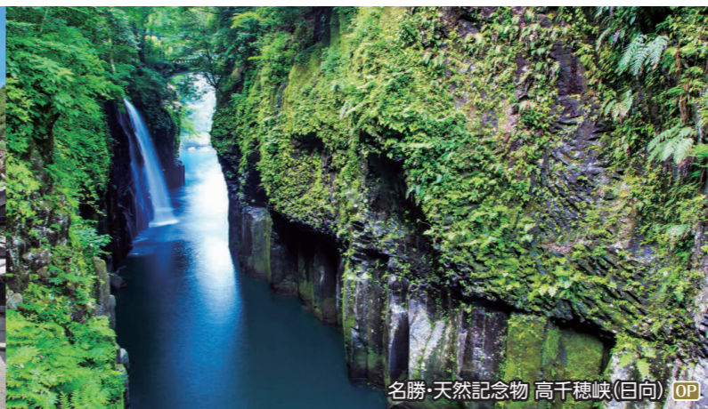
名勝・天然記念物 高千穂峡(日向) OP