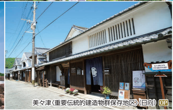
美々津(重要伝統的建造物群保存地区)(日向) OP