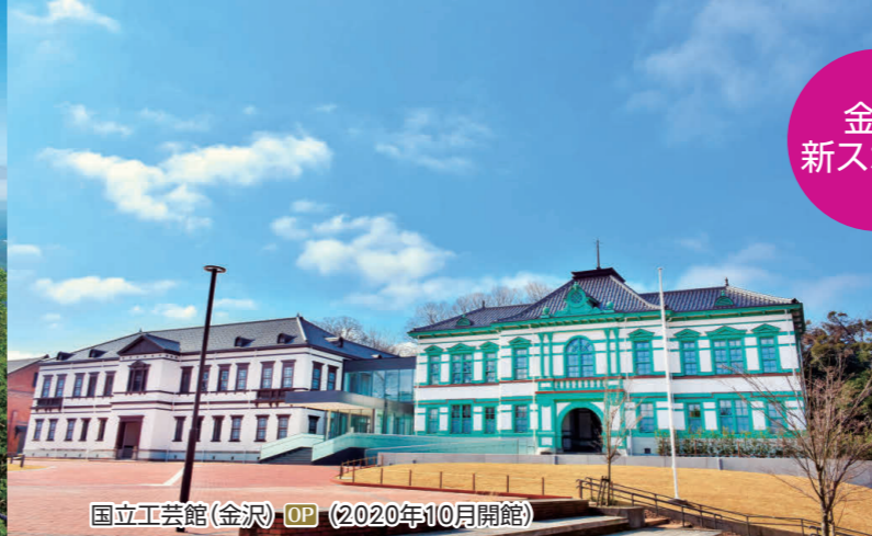
国立工芸館(金沢) OP (2020年10月開館)