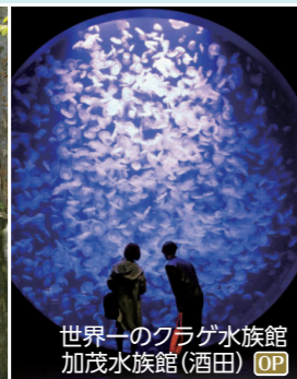
世界一のクラゲ水族館 加茂水族館(酒田) OP