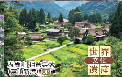
五箇山相倉集落(富山新港) OP