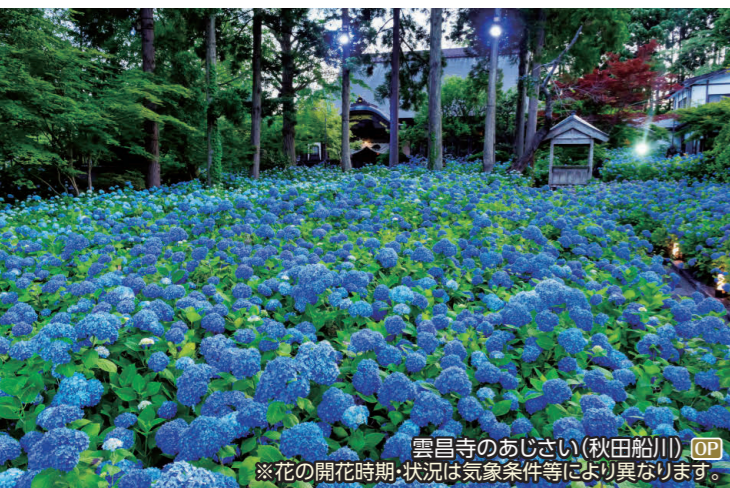
雲昌寺のあじさい(秋田船川) OP ※花の開花時期・状況は気象条件等により異なります。

OP アイヌ文化にふれるウボボイと白老観光 I 白老八幡神社、仙台藩白老陣屋跡、ウボボイ(国立アイヌ民族博物館・伝統芸能鑑賞) ◆所要時間:約7.5時間 ◆お食事:昼食付