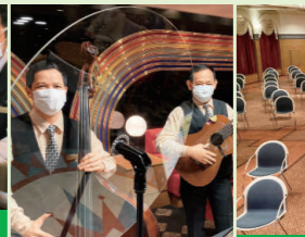
メインホール・メインラウンジは席の間隔をあけてお座りいただけます。