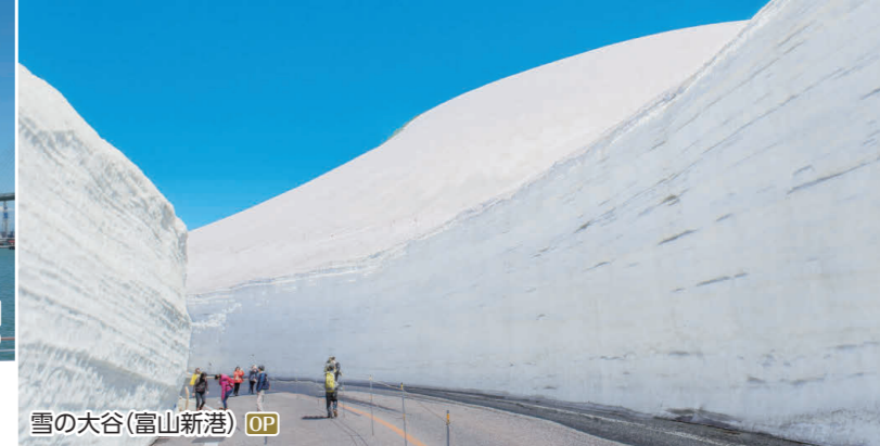
雪の大谷(富山新港) OP

OP 期間限定!アルペンルート全線開業50周年「雪の大谷メモリアルウォーク」 I 雪の大谷ウォーク ◆所要時間:約8時間 ◆お食事:昼食付