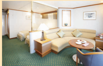
スイート A(1005~1018) B(1019 1020)

定員2名(35㎡ 10階、バス・トイレ・バルコニー付) ※ブルーレイプレーヤー付 ※スイートBは、救命ボートによりベランダの眺望が妨げられます。