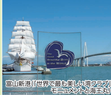
富山新港(「世界で最も美しい湾クラブ」モニュメントと海王丸)

海越しに見える雄大な立山連峰の景観が素晴らしく「世界で最も美しい湾クラブ」にも加盟しています。シロエビを初め豊かな海の幸にも恵まれています。