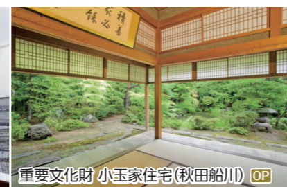
重要文化財 小玉家住宅(秋田船川) OP