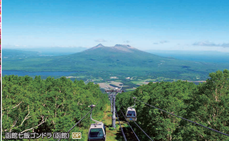
函館七飯 Gondola(函館) OP