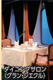
タイムラグサロン (グランデエクル)

◆専用ダイニングで専属シェフによる特別なメニューときめ細やかなサービスでおもてなし。二人掛けテーブルでゆったりとお食事をお楽しみいただけます。 ※ダイニングサロンは未就学児童の方はご利用いただけません。 ※感染症対策の為、お客様の人数によっては食事時間が交代制になる場合がございます。 ◆乗船日にはお部屋にウェルカムスイーツをお届けします。