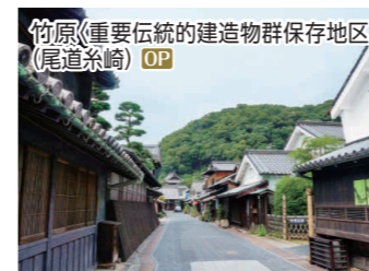
竹原(重要伝統的建造物群保存地区)(尾道糸崎) OP

OP 情緒ある町並み 安芸の小京都「竹原」さんぽ 竹原町並み保存地区(松阪邸・町並み保存センター) ◆所要時間:約4時間 ◆お食事:なし