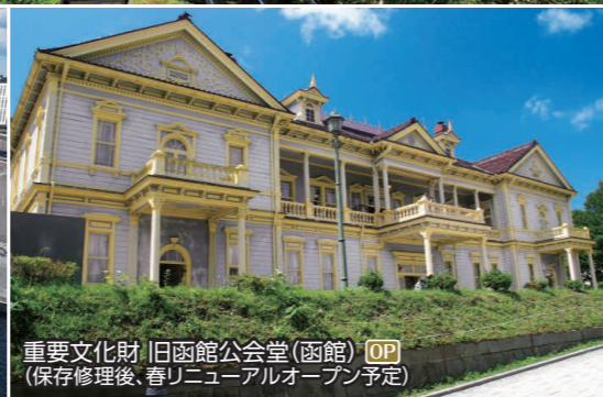
重要文化財 旧函館公会堂(函館) OP (保存修理後、春リニューアルオープン予定)