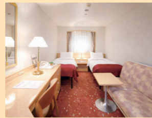
ステートルーム E・F・G・H

デラックスルームご利用の方は、メインダイニングルームのお食事が2回制の場合、ご希望の回数を指定いただけます。