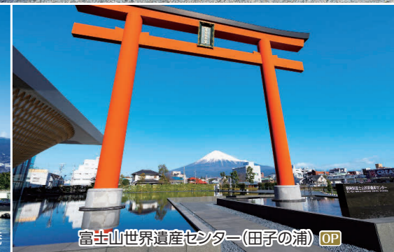
富士山世界遺産センター(田子の浦) OP