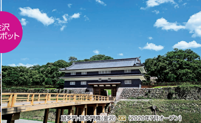
鼠多門・鼠多門橋(金沢) OP (2020年7月オープン)