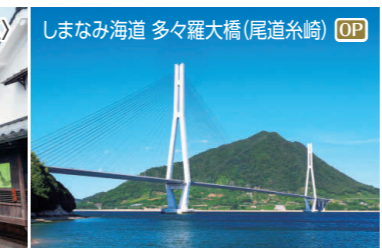
しまなみ海道 多々羅大橋(尾道糸崎) OP