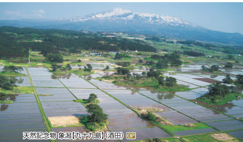
天然記念物 象潟(九十九島)(酒田) OP