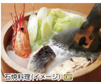
石焼料理(イメージ) OP

寒風山、なまはげ館、真山神社、雲昌寺、入道崎 ◆所要時間:約7時間 ◆お食事:石焼料理の昼食付