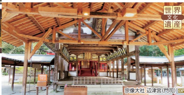
宗像大社 辺津宮(門司) OP