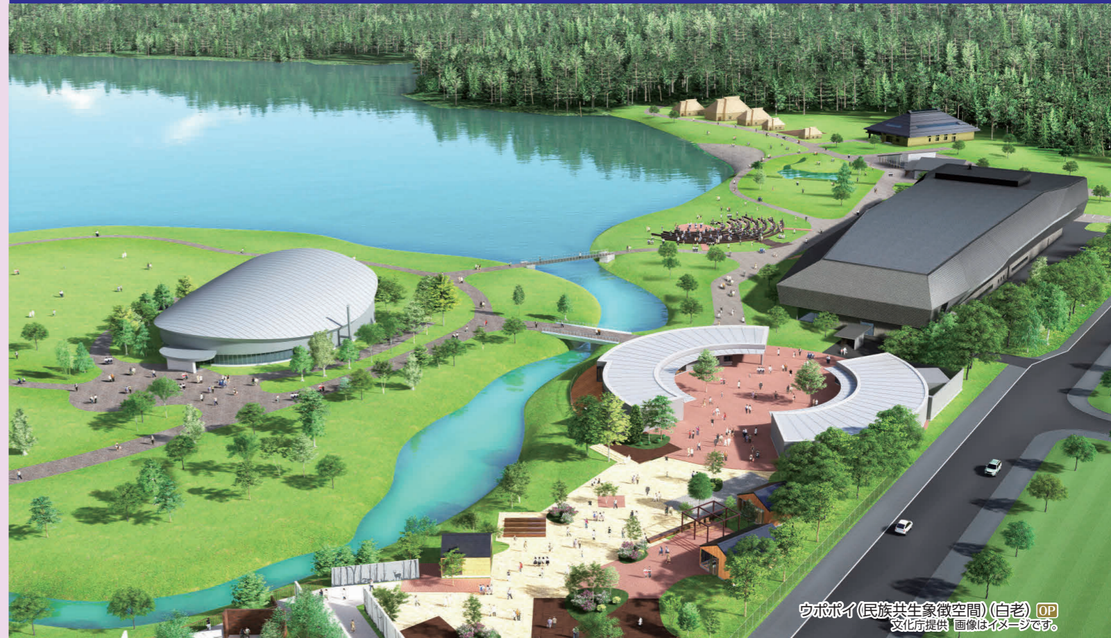
ウポポイ(民族共生象徴空間)(白老) OP 画像はイメージです。