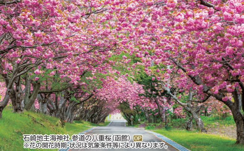
石崎地主海神社 参道の八重桜(函館) OP ※花の開花時期・状況は気象条件等により異なります。