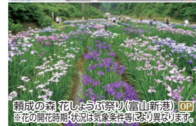
頼成の森花しょうぶ祭り(富山新港) OP ※花の開花時期・状況は気象条件等により異なります。