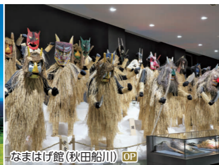
なまはげ館(秋田船川) OP