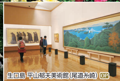
生口島 平山郁夫美術館(尾道糸崎) OP

OP しまなみ海道 瀬戸内の島旅 生口島・大三島2島めぐり I 平山郁夫美術館、大山祇神社(宝物館)、道の駅多々羅しまなみ公園 ◆所要時間:約6.5時間 ◆お食事:昼食付