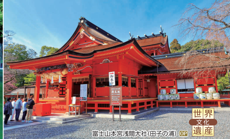
世界文化遺産 富士山本宮浅間大社(田子の浦) OP