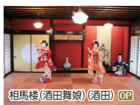
相馬楼(酒田舞娘)(酒田) OP