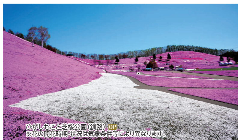
ひがしもと芝桜公園(釧路) OP ※花の開花時期・状況は気象条件等により異なります。