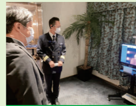
レストランでの検温