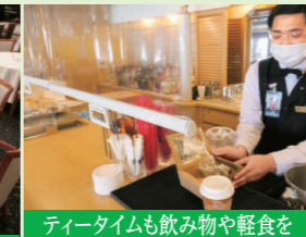
ティータイムも飲み物や軽食をテイクアウトできますので客室でもお召し上がりいただけます。