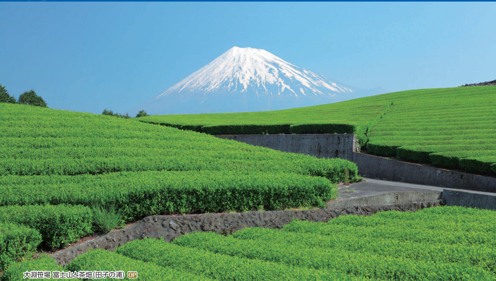
大淵笹場 富士山と茶畑(田子の浦) OP