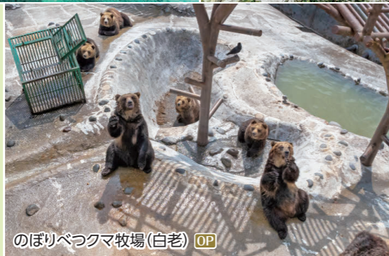
のぼりべつクマ牧場(白老) OP

太平洋側に面した町で、海・山・森林など豊かな自然に恵まれています。この地には昔からアイヌ民族の集落があり、アイヌ民族の歴史と文化を感じられる町です。