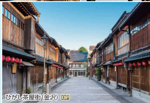
ひがし茶屋街(金沢) OP

加賀百万石の城下町の歴史を今に伝える史跡が多く残されており、昔日の風情を感じられます。新しい観光スポットも出来、さらに魅力を増しています。