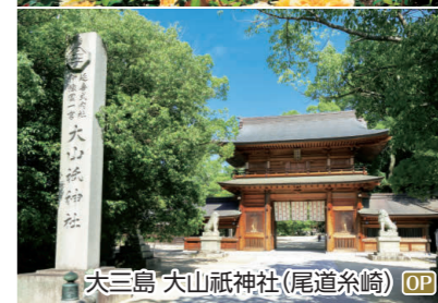
大三島 大山祇神社(尾道糸崎) OP