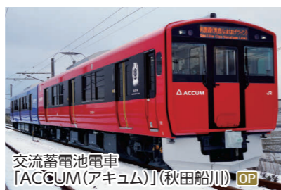
交流蓄電池電車「ACCUM(アキュム)」(秋田船川) OP