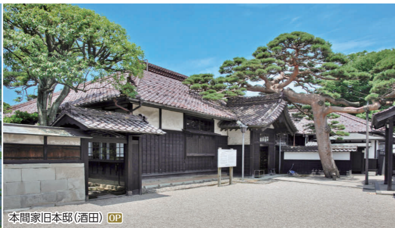
本間家旧本邸(酒田) OP