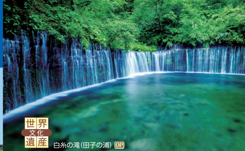
世界文化遺産 白糸の滝(田子の浦) OP