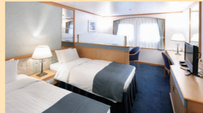
デラックス ルーム

定員2名(35㎡ 10階、バス・トイレ・バルコニー付) ※ブルーレイプレーヤー付 ※スイートBは、救命ボートによりベランダの眺望が妨げられます。