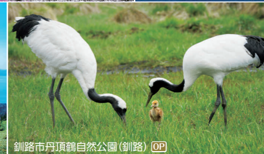
釧路市丹頂鶴自然公園(釧路) OP