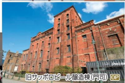
旧サッポロビール醸造棟(門司) OP

OP 世界文化遺産「神の宿る島」の聖地 宗像大社へ I 宗像大社(辺津宮)、新原・奴山古墳群、宮地嶽神社 ◆所要時間:約7.5時間 ◆お食事:昼食付