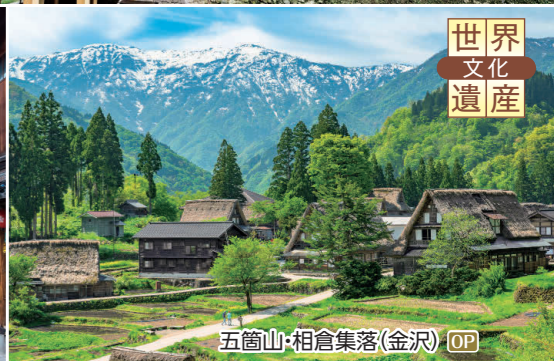
五箇山・相倉集落(金沢) OP