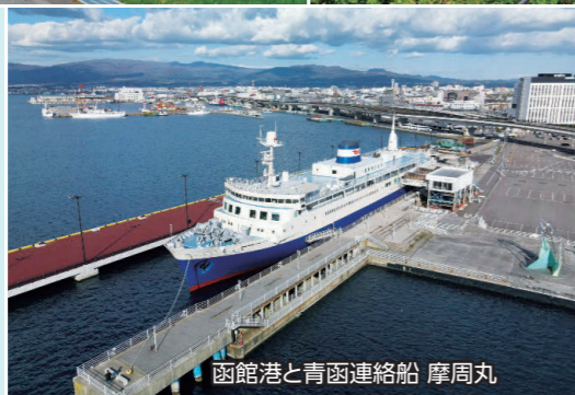
函館港と青函連絡船 摩周丸

建ち並ぶ教会や洋館、坂が織りなす異国情緒漂う街並み、幕末の歴史に翻弄された史跡をはじめ、旬の味覚が楽しめる朝市など多彩な魅力にあふれています。