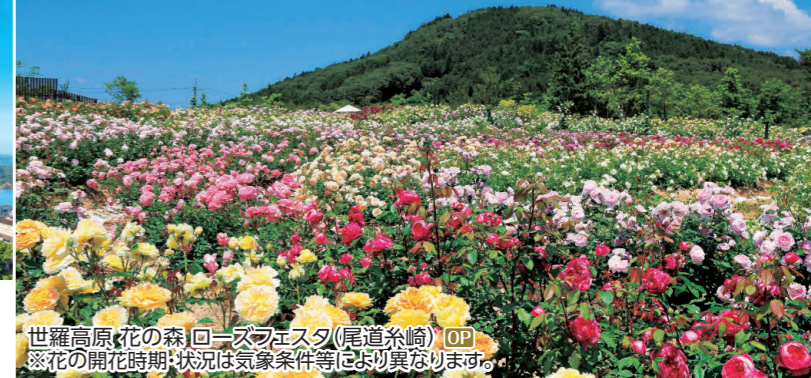
世羅高原花の森 ローズフェスタ(尾道糸崎) OP ※花の開花時期・状況は気象条件等により異なります。