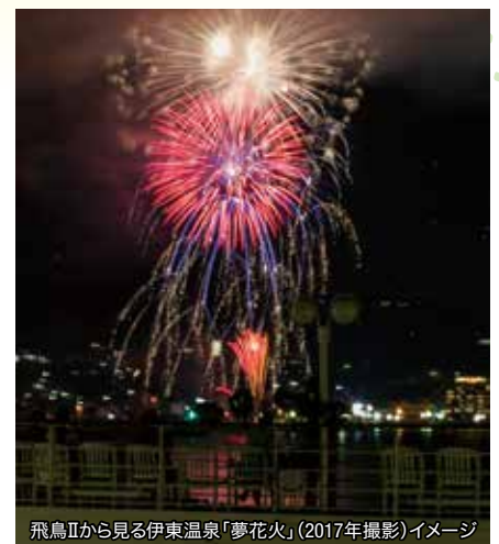
飛鳥IIから見る伊東温泉「夢花火」(2017年撮影)イメージ