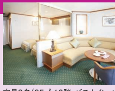
定員2名(35㎡ 10階、バス・トイレ・バルコニー付) ※ブルーレイプレーヤー付 ※スイートBは、救命ボートによりベランダの眺望が妨げられます。