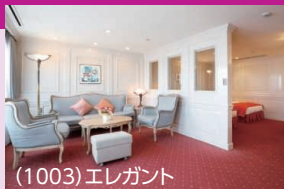
(1003) エレガント 定員2名(65㎡ 10階、展望/バス・トイレ・バルコニー付) ※ブルーレイプレーヤー、インターネット閲覧専用ノートパソコン付