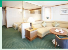
定員2名(35㎡ 10階、バス・トイレ・バルコニー付) ※ブルーレイプレーヤー付