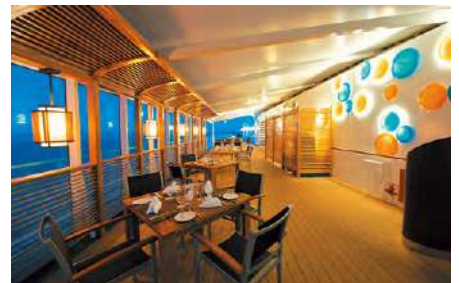
ル・グリル [朝食] [昼食] [夕食・要予約]

ディナーのためだけにオープンするこの優雅なメインダイニング「レトワール」では、美しく施された内装、そして魅惑的なスペシャリテをもって五感を満たします。メニューは日替わりで、無料のワインとのペアリングもお楽しみください。※予約不要のオープンシーティングのレストランです。