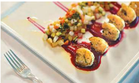
ラ・ベランダ [朝食] [昼食] [夕食・要予約]

オーシャンビューのお席や屋外デッキでのお食事を楽しめる「ラ・ベランダ」では、寄港地にインスピレーションを受けたアラカルトや、趣向を凝らしたビュッフェ(朝食・昼食)をご提供しております。ディナーは、パリの有名シェフ ジャン・ピエール・ヴィガト監修のグルメキュイジーヌをご堪能いただけるスペシャルティ・レストラン(予約制)となります。