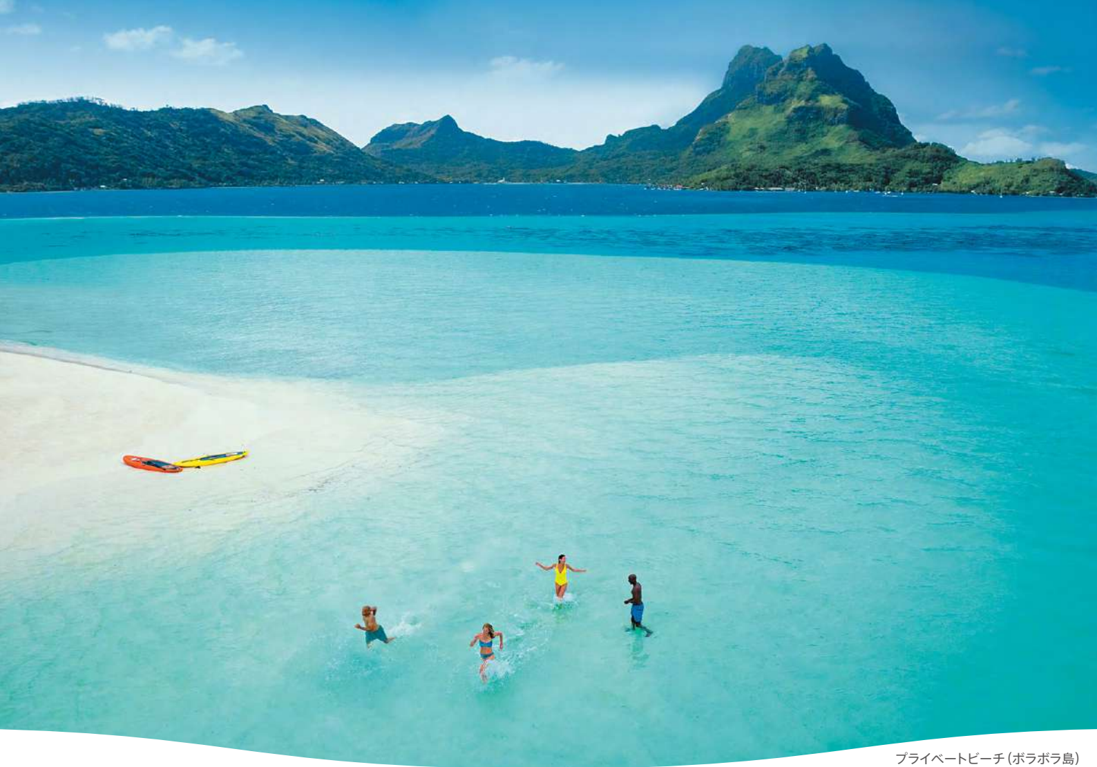
プライベートビーチ (ボラボラ島)