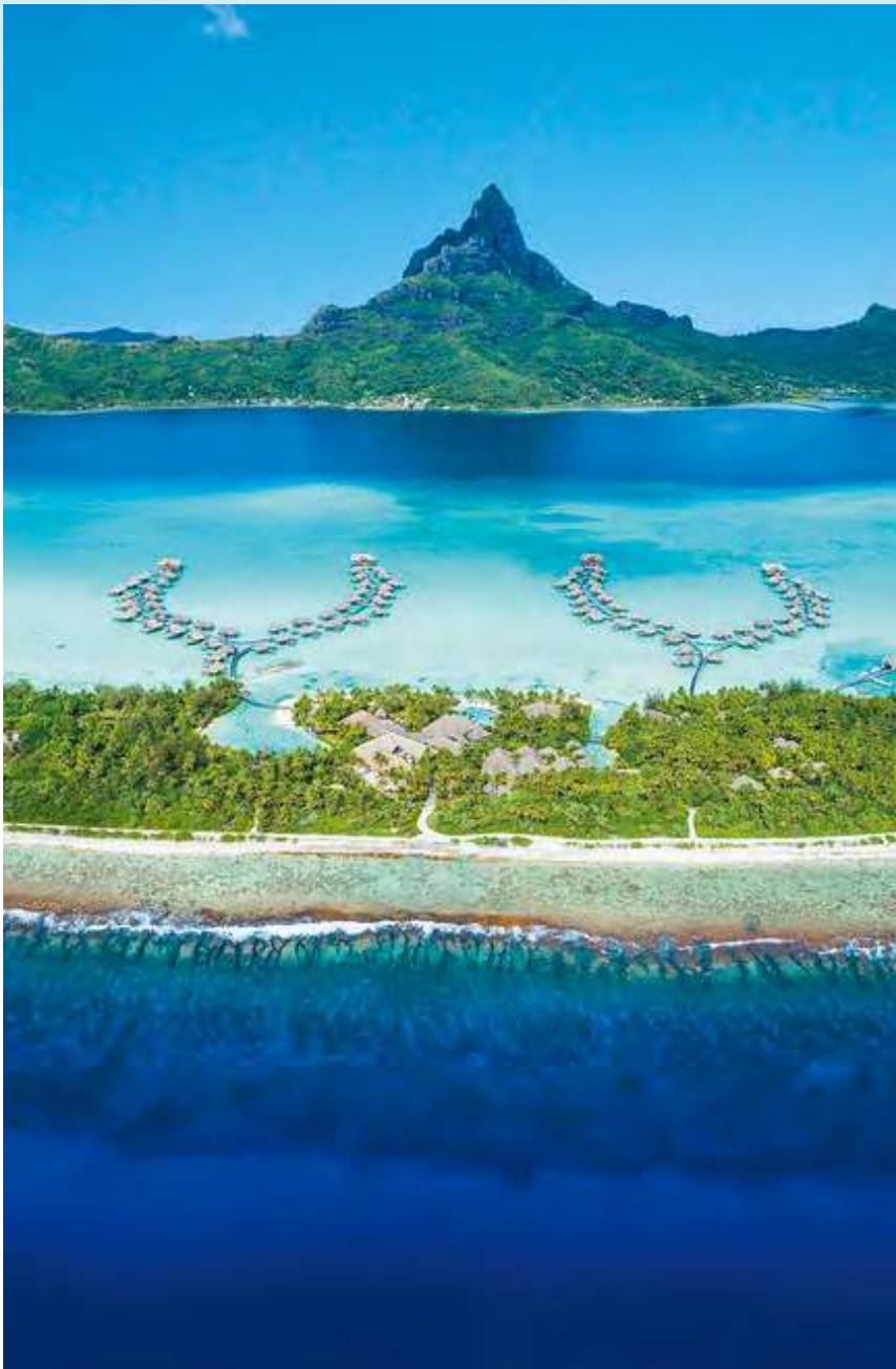
インターコンチネンタル・ボラボラ・リゾート&タラソ・スパ