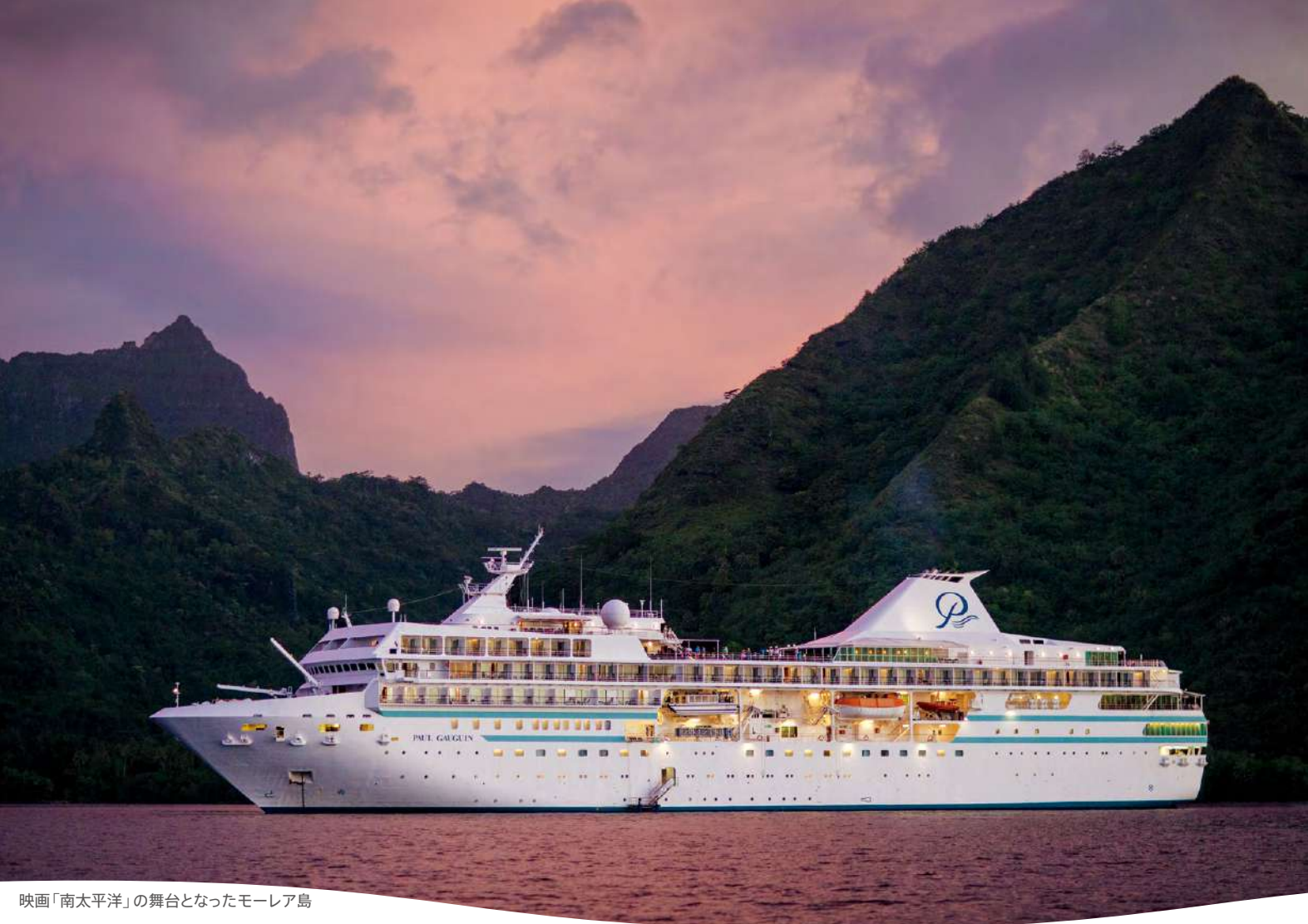
映画「南太平洋」の舞台となったモーレア島