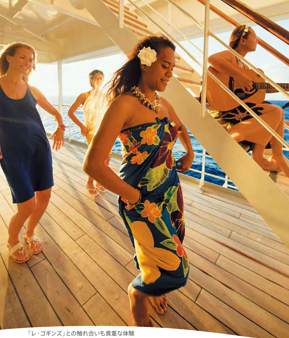
「レ・ゴギンズ」との触れ合いも貴重な体験