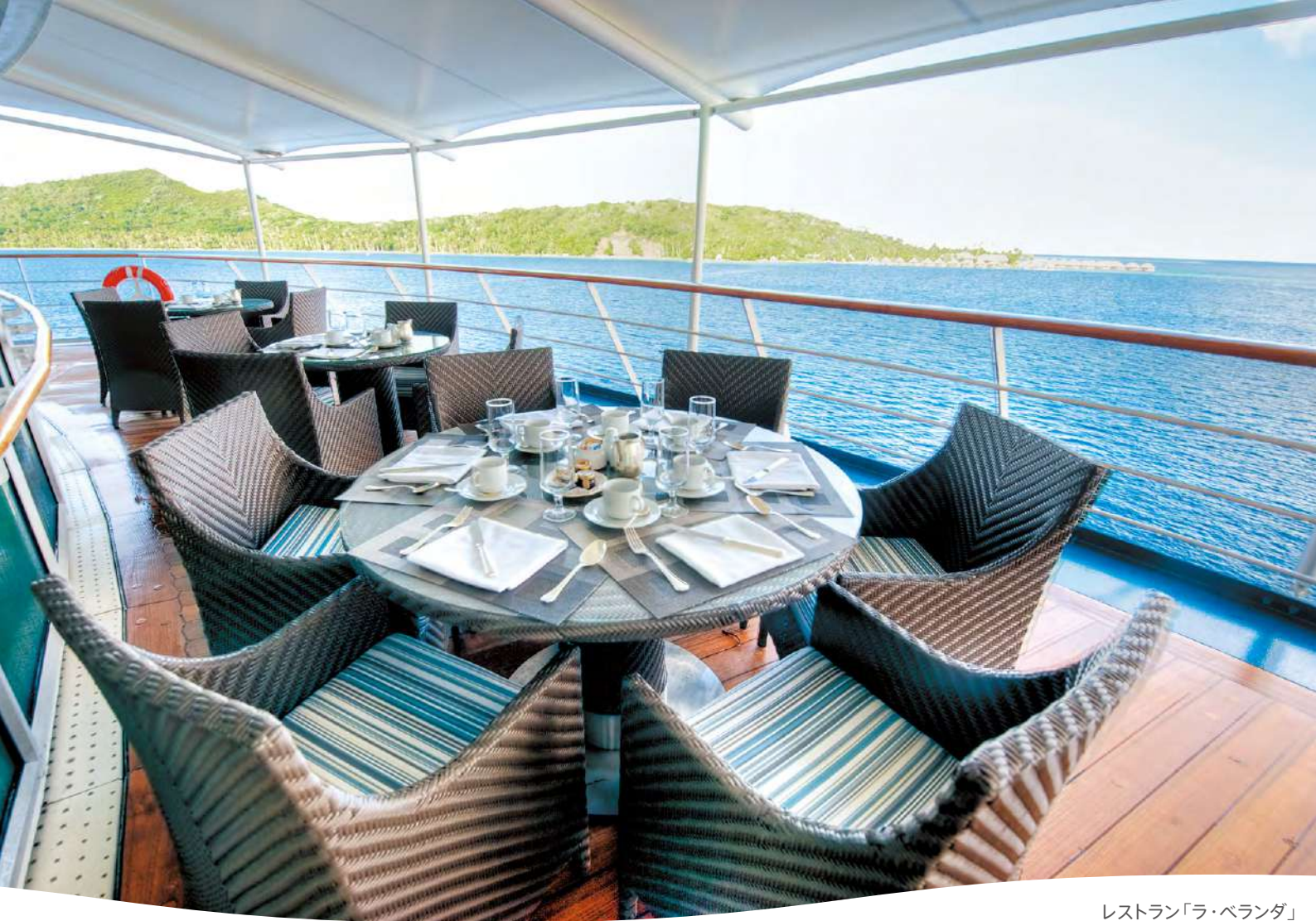
レストラン「ラ・ベランダ」