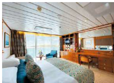
A ベランダ・スイート

客室は全室オーシャンビュー、ほとんどの客室がバスタブ付きでバスローブやスリッパ、アルゴテルムのアメニティも備えています。カテゴリ B 以上にはバトラーサービスが付きまます。