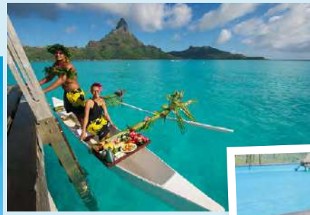
カヌー・ブレイクファースト (イメージ)