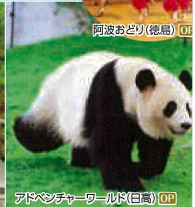
アドベンチャーワールド(日高) OP

ご旅行代金 (おとなおひとり様・単位/円・消費税込) ( )は子供代金(2歳以上小学生以下)