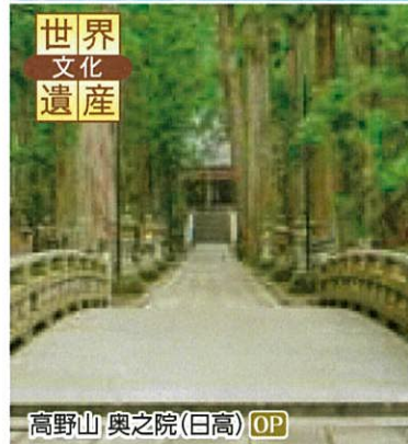
高野山 奥之院(日高) OP