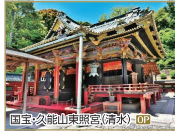
国宝・久能山東照宮(清水) OP

OP 日本平 夢テラスと 久能山東照宮 ◆所要時間: 約3.5時間 ◆お食事:なし