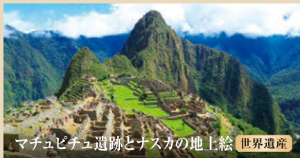
マチュピチュ遺跡とナスカの地上絵 世界遺産