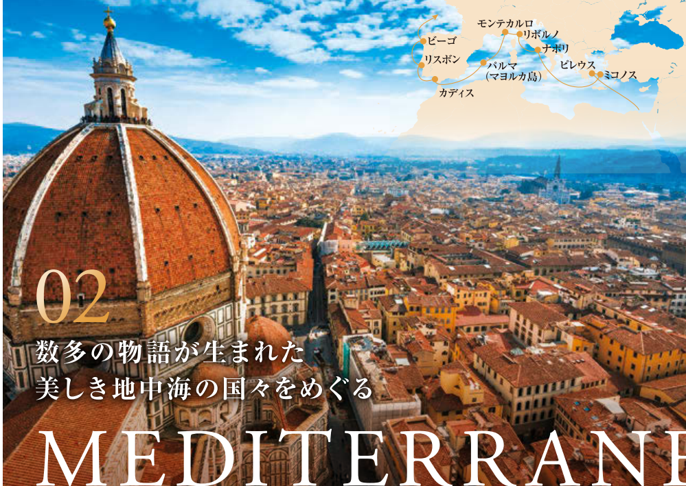
フィレンツェの街並み(リボルノ)