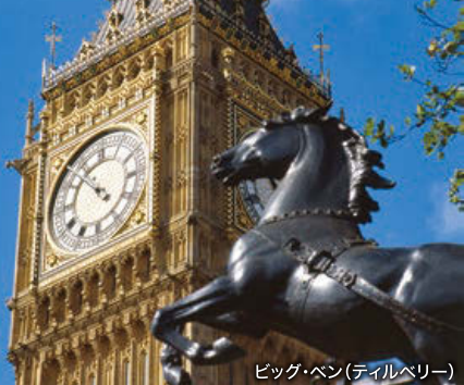
ビッグ・ベン(テイルベリー)