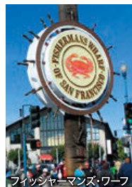
フィッシャーマンズ・ワーフ

赤い橋ゴールデンゲートブリッジがシンボルの風光明媚な街で、坂が多い市街では路面電車が走ります。フィッシャーマンズ・ワーフなどの名所のほか、カリフォルニアワインの産地ナパバレーへも訪れていただけます。