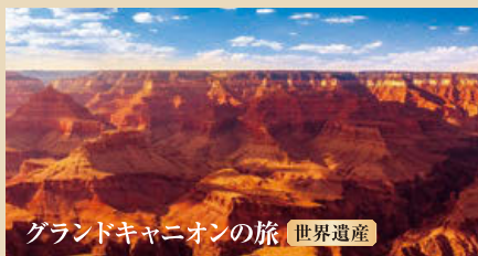
グランドキャニオンの旅 世界遺産