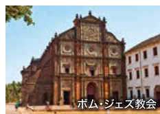
ボム・ジェズ教会

インド西海岸の美しいビーチリゾート。ポルトガル統治時代の面影が残り、フランシスコ・ザビエルの聖遺物が納められているボム・ジェズ教会などの文化遺産も見どころです。