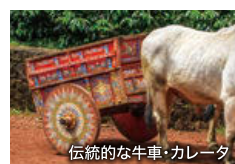
伝統的な牛車・カレータ