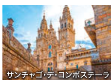
サンチャゴ・デ・コンポステーラ