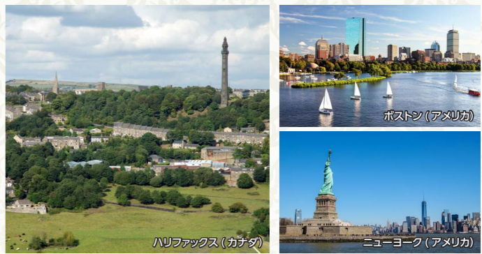
ハリファクス(カナダ)