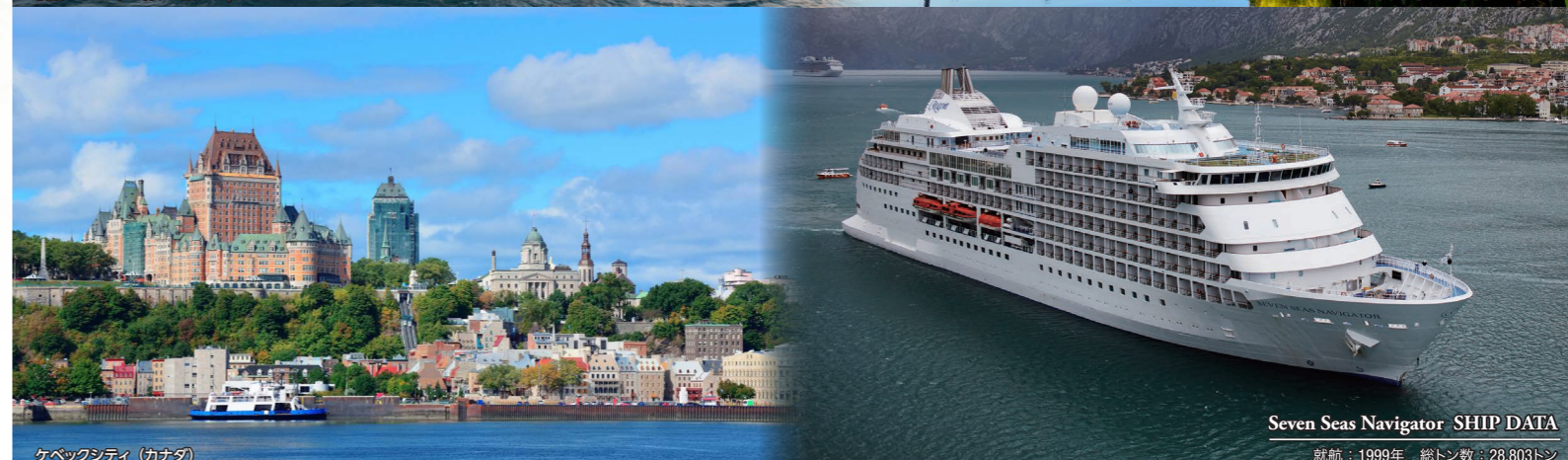
ケベックシティ(カナダ)