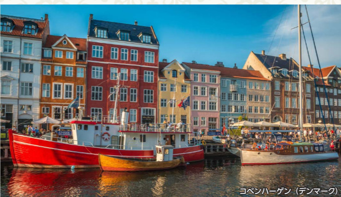
コペンハーゲン(デンマーク)

コペンハーゲンには12世紀に築かれ、後期ルネッサンス建築とロココ建築の宝庫です。「北のベニス」と称賛されて、数々の島と入り江の上に築かれたこの街は、穏やかな運河がめぐらされています。この町のシンボル、アンデルセンの人魚姫の像や500年の歴史ある切妻造りの建物が並ぶ旧港ニューハウン沿いは、最もコペンハーゲンらしい風景が広がっています。