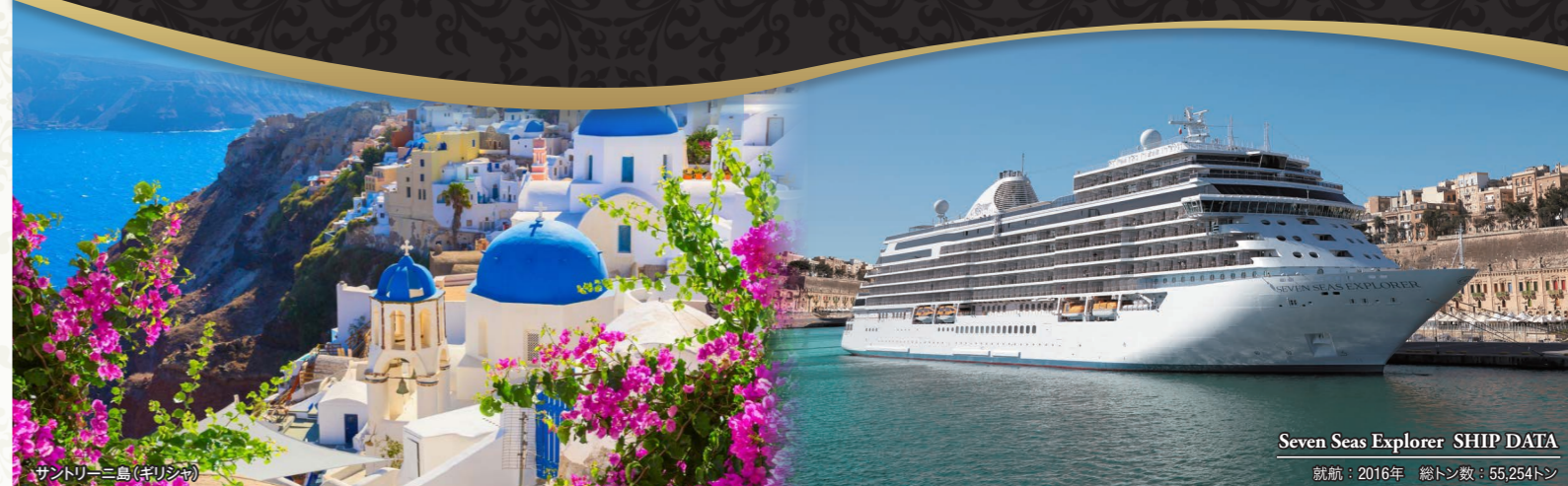
サントトリーニ島(ギリシャ)