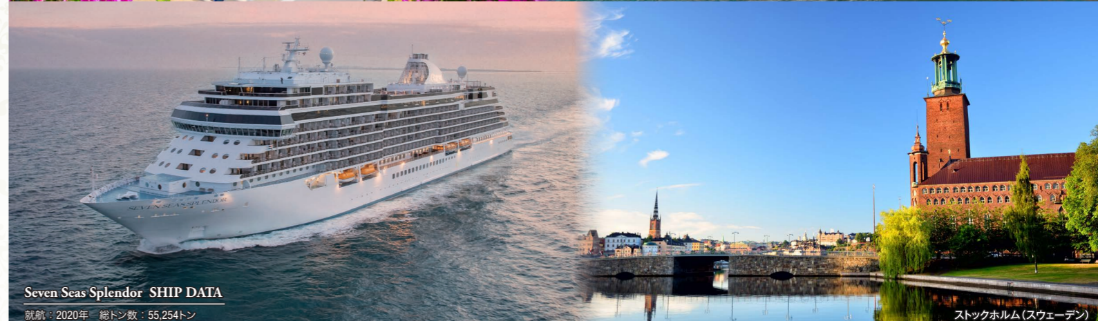
Seven Seas Splendor SHIP DATA