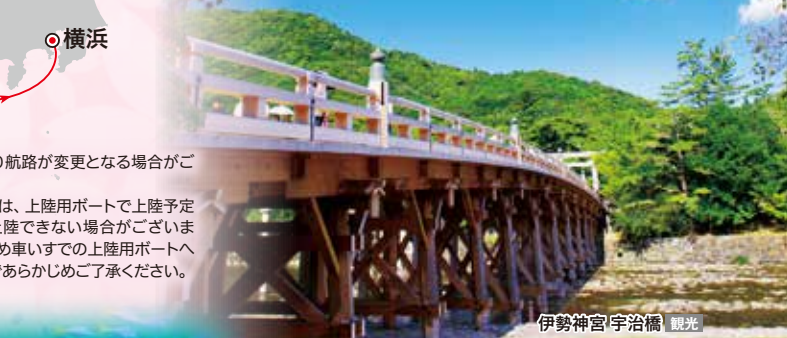
伊勢神宮 宇治橋 観光

※天候その他の事情により航路が変更となる場合がございます。 ※通船：3月14日鳥羽では、上陸用ポートで上陸予定です。天候によっては上陸できない場合がございます。なお、安全確保のため車いすでの上陸用ポートへの乗船はできませんのであらかじめご了承ください。