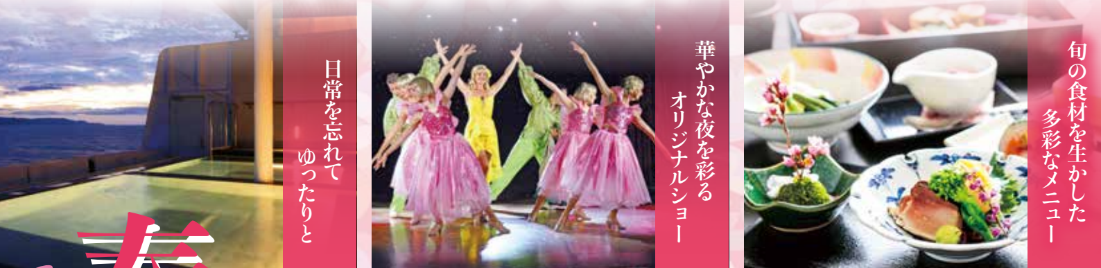
日常を忘れて ゆつたりと