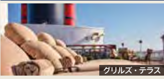
グリルズ・テラス