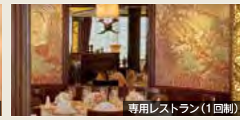
専用レストラン(1回制)