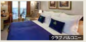
クラブバルコニー