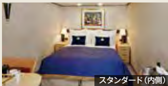
スタンダード(内側)