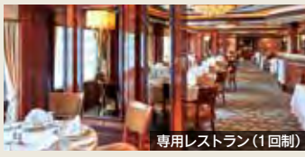
専用レストラン(1回制)