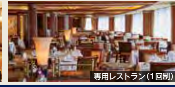
専用レストラン(1回制)