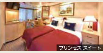
プリンセススイート