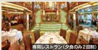
専用レストラン(夕食のみ2回制)