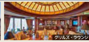
グリルズ・ラウンジ