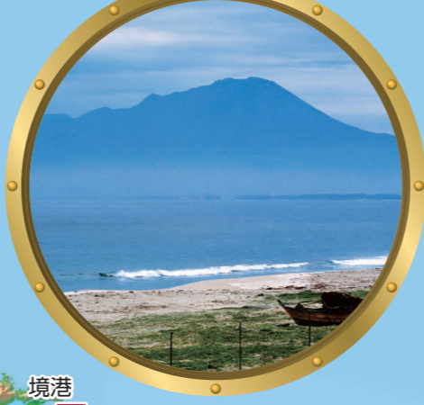
5 大山 弓ヶ浜半島沖より雄大な大山を望みます