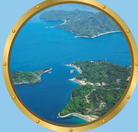
3 怒和島水道 怒和島と津和地島の間にある狭水道