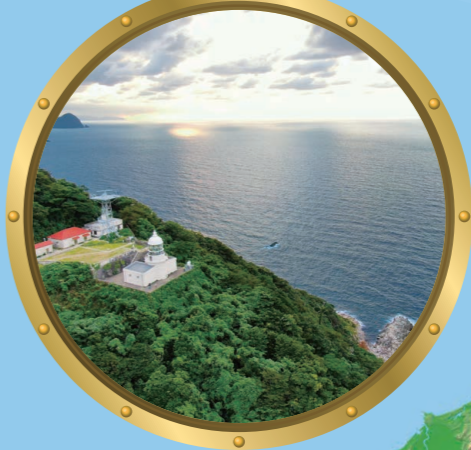
6 経ヶ岬 丹後半島の最北端にある岬