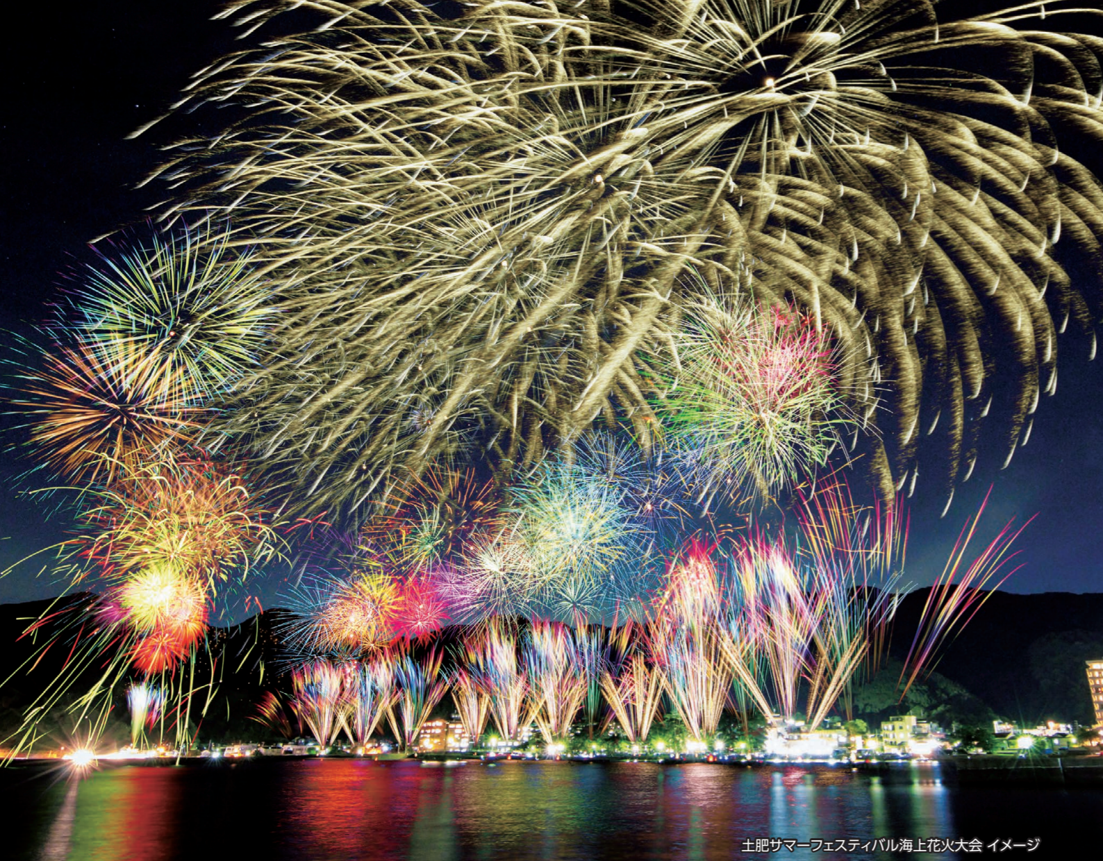
土肥サマーフェスティバル海上花火大会 イメージ