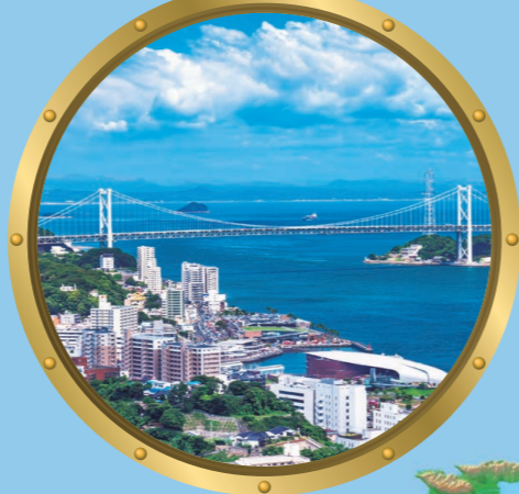
4 関門橋 源平合戦の地・壇ノ浦に架かる大橋