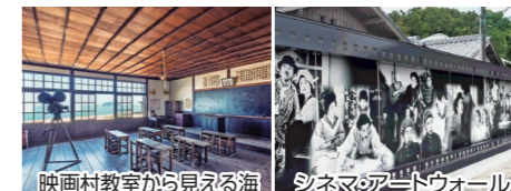
映画村教室から見える海