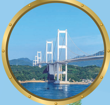
2 来島海峡大橋 来島海峡に架かる世界初の3連吊橋