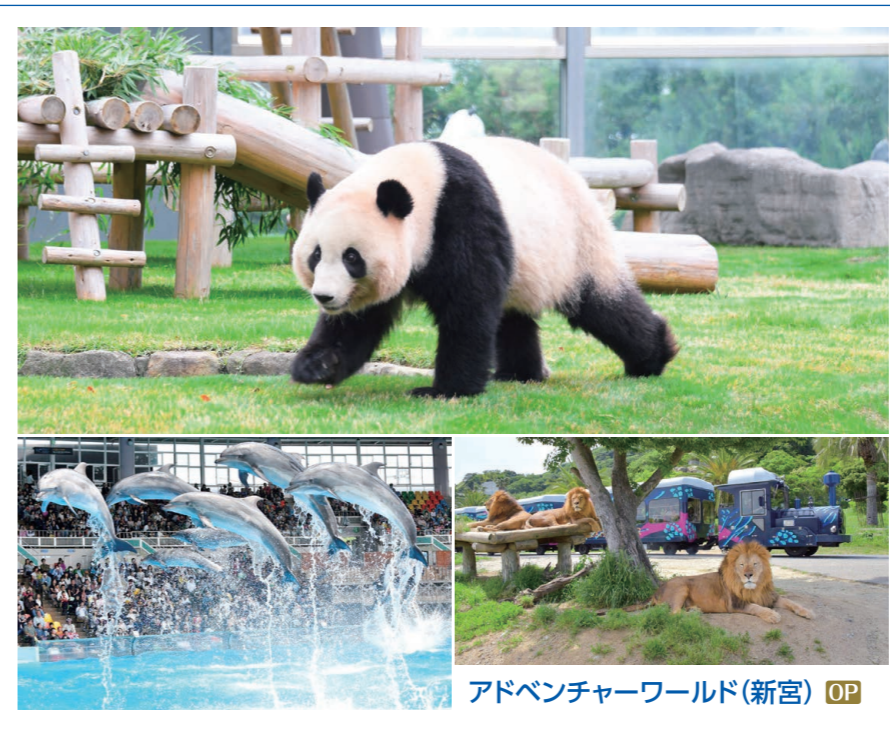
アドベンチャーワールド(新宮) OP