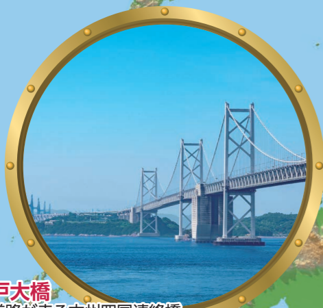
1 瀬戸大橋 鉄道と道路が走る本州四国連絡橋