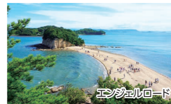
エンジェルロード

1日に2回、干潮の時だけ海の中から砂の道が現れます。天使が願いを叶えてくれると言われており、幻想的なスポットです。