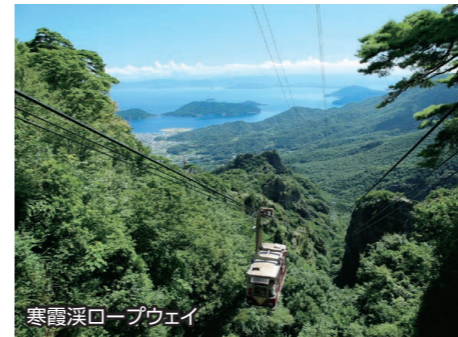
寒霞渓ロープウェイ

山頂を散策してハートの形をした松を探しましょう。ハート松と白いベンチは人気のフォトスポットです。