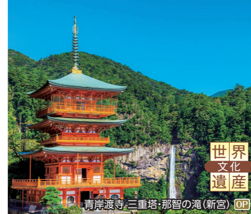
青岸渡寺・三重塔・那智の滝(新宮) OP