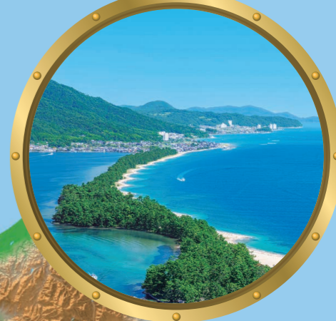
7 天橋立 日本三景の一、自然美の湾口砂州