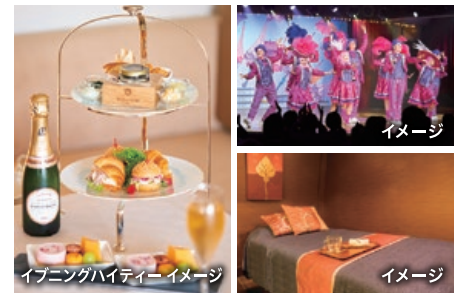
イブニングハイティーイメージ