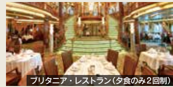
ブリタニア・レストラン(夕食のみ2回制)