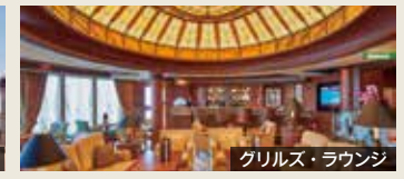
グリルズ・ラウンジ