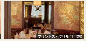
プリンセス・グリル(1回制)