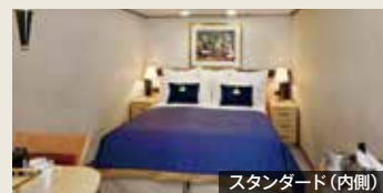
スタンダード(内側)