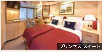
プリンセススイート