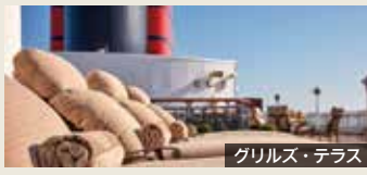
グリルズ・テラス