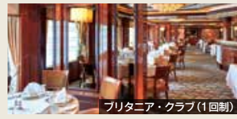
ブリタニア・クラブ(1回制)