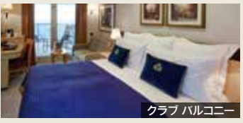
クラブバルコニー