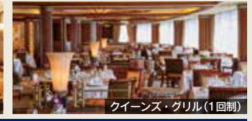
クイーンズ・グリル(1回制)