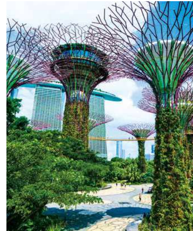
ガーデンズ・バイ・ザ・ベイ(シンガポール)

※客室をお一人様でご利用の場合にはステートルーム130%、デラックスルーム、スイートルームは200%の割増代金となります。 ※子供代金、その他の客室はお問い合わせください。