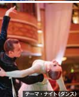
テーマ・ナイト(ダンス)