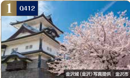
金沢城(金沢)