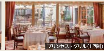
プリンセス・グリル(1回制)