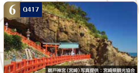
鶴戸神社(宮崎)

●食事: 朝食9回、昼食8回、夕食9回 ●ダンスがテーマのクルーズです。特別編成のビッグバンドの生演奏をバックに、ダンスをお楽しみいただけます。