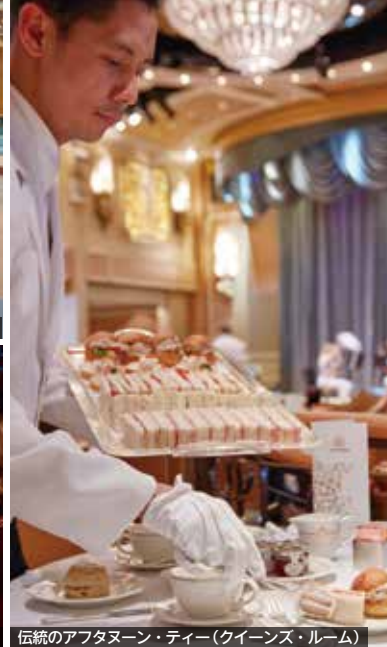
伝統のアフタヌーン・ティー(クイーンズ・ルーム)