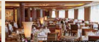
クイーンズ・グリル(1回制)