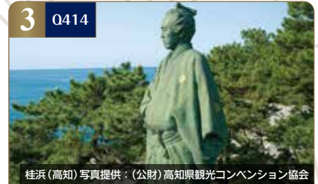
桂浜(高知)