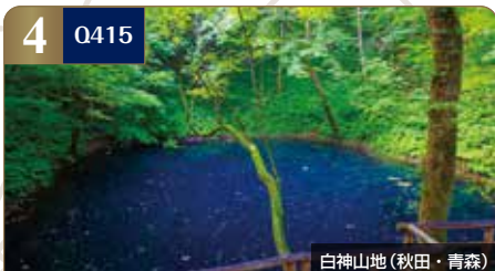
白神山地(秋田・青森)