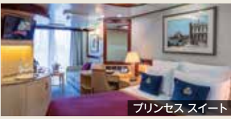
プリンセス・スイート