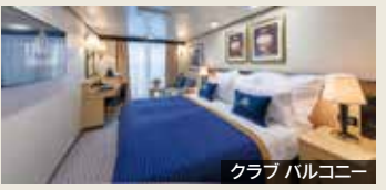
クラブバルコニー