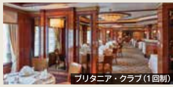
プリンセス・クラブ(1回制)