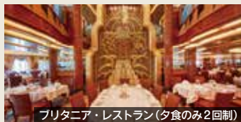
プリンセス・レストラン(夕食のみ2回制)