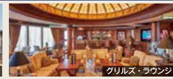
グリル・ラウンジ