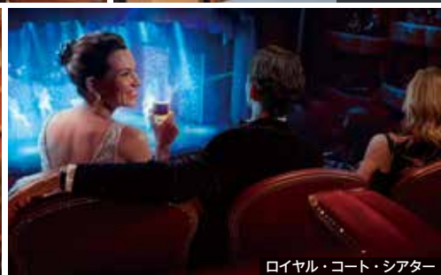
ロイヤル・コート・シアター