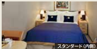
スタンダード(内側)