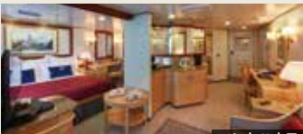
グランド・スイート