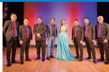
※編成は異なります。