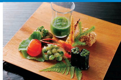
美山荘料理 (イメージ)

関西の食文化を伝える情報誌『あまから手帖』との タイアップクルーズ。15年ぶりに美山荘が登場します。