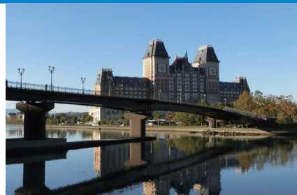
ハウステンボス駅