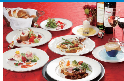
クリスマスディナー（イメージ）