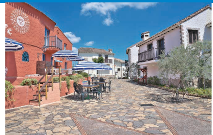
志摩地中海村の街並み