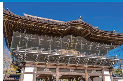
成田山新勝寺 総門

名古屋からは木更津港へ寄港、 木更津と下田で、それぞれ1つ無料ツアーを お選びいただけます。