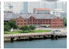
赤レンガ倉庫 創建100年を超える赤レンガ造りの歴史的建造物を利用した商業施設です。