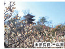
三溪園(国指定名勝) 横浜・本牧に広がる175,000㎡もの日本庭園。歴史的建造物や季節ごとの花々を觀賞いただけます。