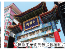
横浜中華街 言わずと知れた日本最大の中華街。