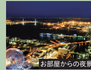
お部屋からの夜景

横浜みなとみらいを一望する絶景をお楽しみいただけます。 横浜ランドマークタワー内にあるため、お出かけもお気軽に。