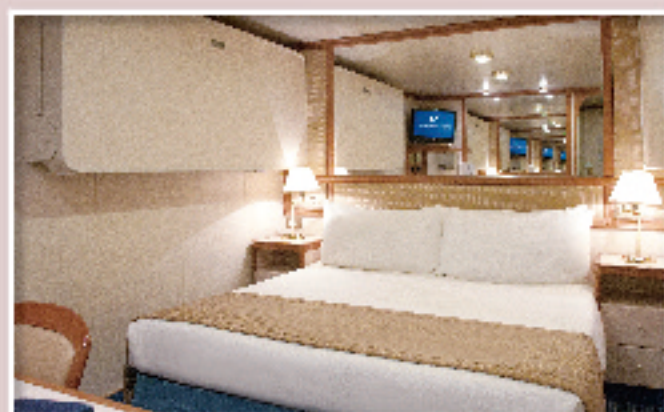
内側(約15㎡) シャワー/窓なし