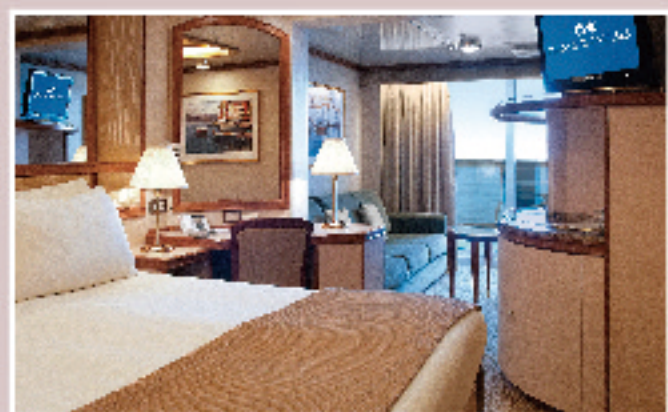
ジュニアスイート(約30㎡) バスタブ/バルコニー付