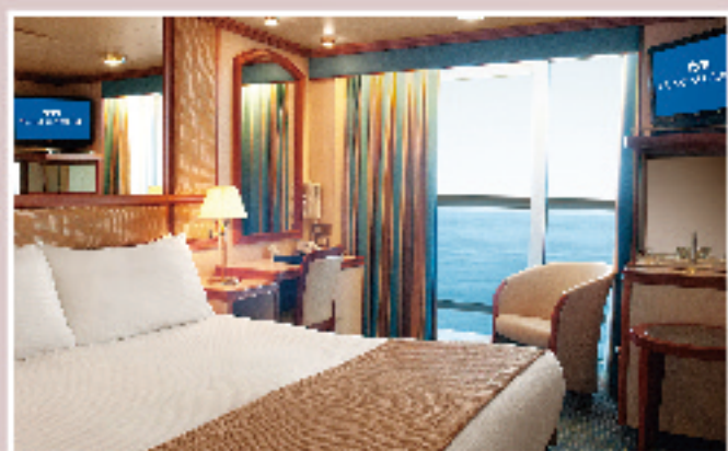
海側バルコニー(約20㎡) シャワー/バルコニー付