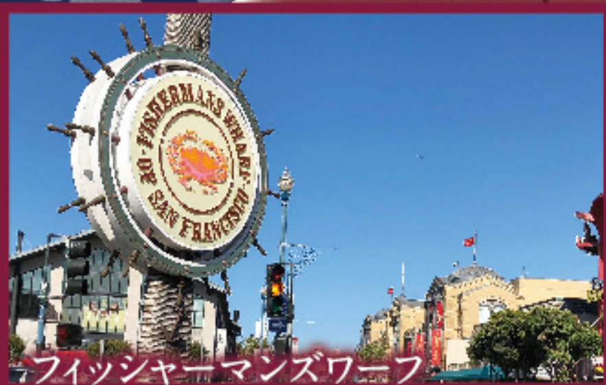
フィッシャーマンズワーフ