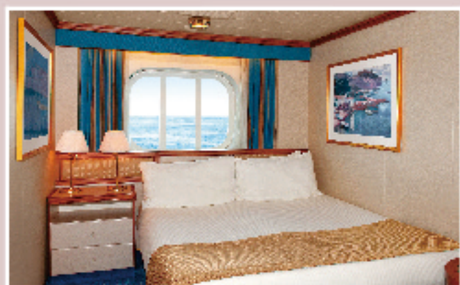
海側(約15㎡) シャワー/窓付