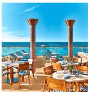
WORLD CAFÉ & AQUAVIT TERRACE®