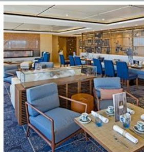
MAMSEN'S® NORWEGIAN DELI