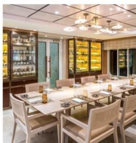
THE CHEF'S TABLE