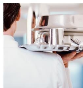
24-HOUR ROOM SERVICE