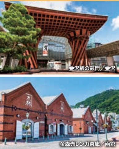
金沢駅の鼓門/金沢