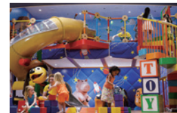
A2 アンディのトイボックス

スパイダーマンなどヒーローたちの新型スーツ体験、極秘のテクノロジー、エキサイティングなトレーニングを楽しもう!