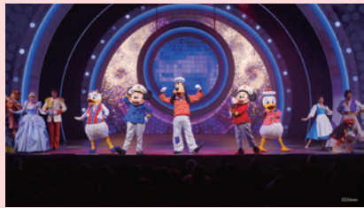
7 エリア ウォルト・ディズニー・シアター

映画「ウォーリー」のロボットたちが主役の、愛と憧れの物語。この新しい感動のミュージカルは、「リメンバーミー」「リトル・マーメイド」「アラジン」などのヒーローたちが、音楽と希望、大切な思い出の力で「イヴ」の記憶を取り戻そうと奮闘する物語です。