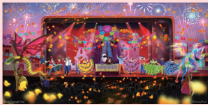
7 エリア ウォルト・ディズニー・シアター

全く新しいライブショーが開幕します。愛らしいキャラクターたちや、陽気なカモメの案内役「ティッピー・ブルー」と一緒に、冒険の旅へ! 魅力的な音楽、美しい映像、喜びに満ちたひとときとともに、海の魔法、想像の力、そして本当の友情を発見しましょう。