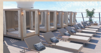
コンシェルジュ・サンデッキ

広々とした専用サンデッキでは、心地よいデッキチェアでくつろいだり、ジェットバスでリラックスしたり、日陰付きプールでゆったりと過ごしたり…。前方に広がる壮大な海のパノラマとともに楽しみください。