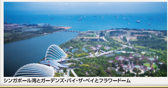
シンガポール湾とガーデンズ・バイ・ザ・ベイとフラワードーム

注1)クルーズ船は7:00着岸後、準備が整い次第、下船のご案内となりますので、時間を要します。 注2)成田・中部・福岡発の方は、下船後、空港へお送りし、アーリーチェックイン及び荷物預け後(24時間前から可能)、自由行動となります。 注3)便宜上、機内泊としていますが、成田・中部・福岡発着の復路:シンガポール発は、23:55～日付を超えた01:20となります。