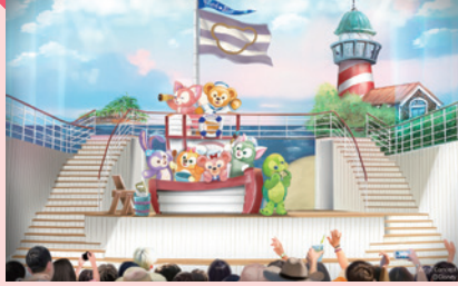
1 エリア ガーデン・ステージ