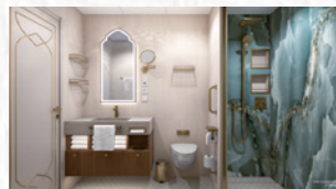
バスルーム (コンシェルジュ/イメージ)