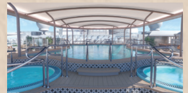
コンシェルジュ・プール