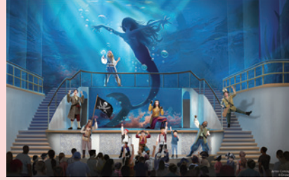
1 エリア ガーデン・ステージ