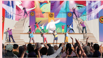
1 エリア ガーデン・ステージ

ウェイファインダー・ベイで、ゆったりくつろぎながら、モアナの物語を描いたミュージカルをお楽しみください。この感動的なショーは、音楽やダンス、人形劇、水の演出で、モアナの勇気、自分探し、友情に満ちた壮大な冒険の旅を描いています。