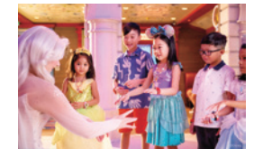
A3 フェアリーテイル・ホール

映画の小道具や小物があふれる「トイ・ストーリー」の世界を再現した巨大なプレイ・グラウンド!