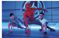
A1 マーベル・ウェブ・ワークショップ

ディズニー、ピクサー、マーベルの人気ストーリーをモチーフにしたテーマパークです。下記のようなキャラクター、ヒーロー、プリンセスとの体験にも夢中になるでしょう。