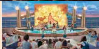
モアナの物語を描いたミュージカル