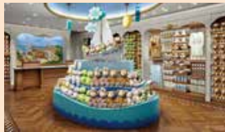
ダフィーと仲間たちのショップもオープン