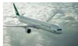
フライト(イメージ)