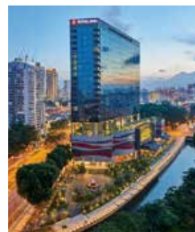
ホテル(一例:ホテル・ボス外観)