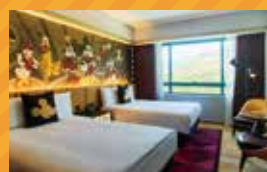
ミッキー&フレンズルーム(イメージ)