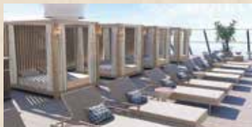
コンシェルジュ・サンデッキ

広々とした専用サンデッキでは、心地よいデッキチェアでくつろいだり、ジェットバスでリラックスしたり、日陰付きプールでゆったりと過ごしたり…。前方に広がる壮大な海のパノラマとともに楽しみください。