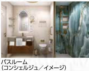
バスルーム (コンシェルジュ/イメージ)