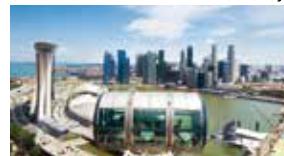
高さ165mの観覧車「シンガポール・フライヤー」 からの眺め(左:マリーナベイ・サンズ)

ショッピングモールやレストランが立ち並び中心地・オー チャードロードにも近く、落ち着いたインテリアと雰囲気 で、日本人にも人気のホテルです。(バスタブ&シャワー付き)