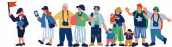
現地日本語係員による送迎や観光(イメージイラスト)