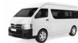
現地送迎車(イメージ)