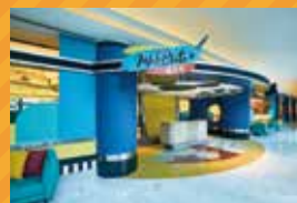
レストラン「インク&プレート」