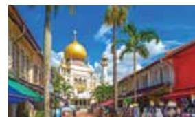
アラブストリート

●クルーズは3泊または4泊から選択可能! キャビンも5つのカテゴリーから選べ、出発日も選べます。 ●香港ディズニーランド直営ホテルに2連泊!!、 2デー・パーク・チケット付 ※帰国日は半日入場となります。