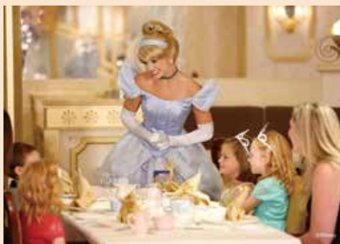
プリンセスとティーパーティー(3～12歳と保護者/別料金)