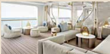
コンシェルジュ・ラウンジ

『アラジン』の神秘的都・アグラバーをテーマにしたラウンジで、リフレッシュメントやグルメなおつまみなどをお楽しみいただけます。魔法のじゅうたんをかたどったフィンバーや、ジューシーをイメージしたキッズコーナーでは、おやつとディズニー映画をお楽しみください。