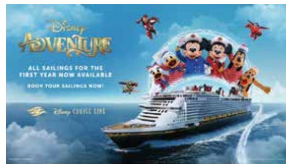
ディズニー・アドベンチャー