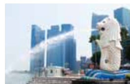
マールライオン公園