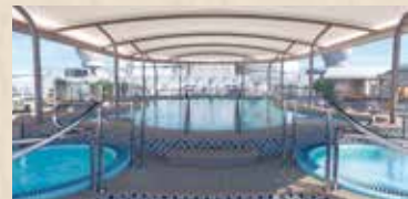
コンシェルジュ・プール