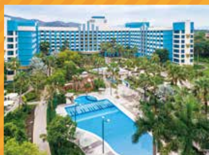
ディズニー・ハリウッド・ホテル 外観(イメージ)