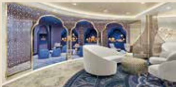
コンシェルジュ・ラウンジ(キッズ・スペース)