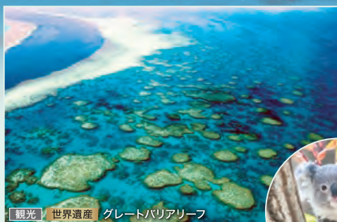
観光 世界遺産 グレートバリアリーフ