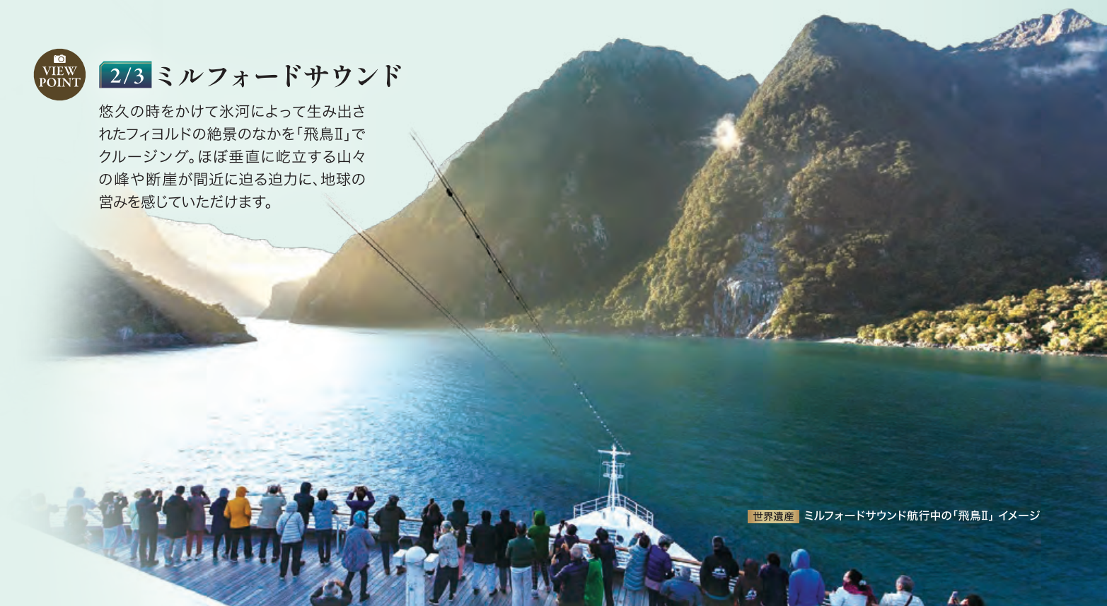
世界遺産 ミルフォードサウンド航行中の「飛鳥II」イメージ

悠久の時をかけて氷河によって生み出されたフィヨルドの絶景のなかを「飛鳥II」でクルージング。ほぼ垂直に屹立する山々の峰や断崖が間近に迫る迫力に、地球の営みを感じていただけます。