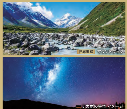
世界遺産 マウントクック

巨大な一枚岩が鎮座する、オーストラリア中央部のアボリジニーの聖地ウルル(エアーズロック)へ。