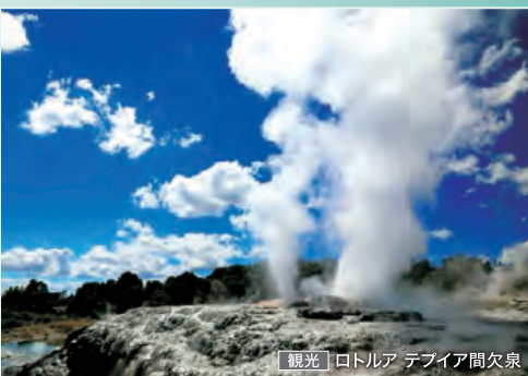
観光 ロトルア デブイア間欠泉