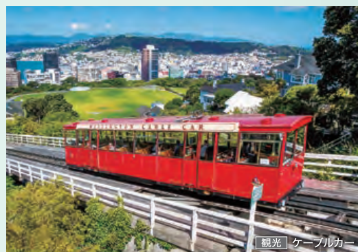
観光 ケーブルカー

観光 紙の大聖堂とクライストチャーチゴンドラ、 アーサーズバス国立公園とトランツアルパイン鉄道 ほか