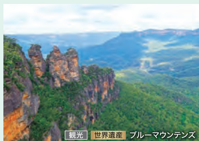
観光 世界遺産 ブルーマウンテンズ