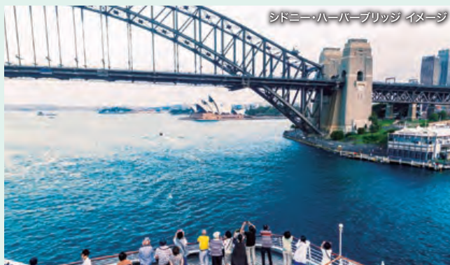
シドニー・ハーバーブリッジ イメージ