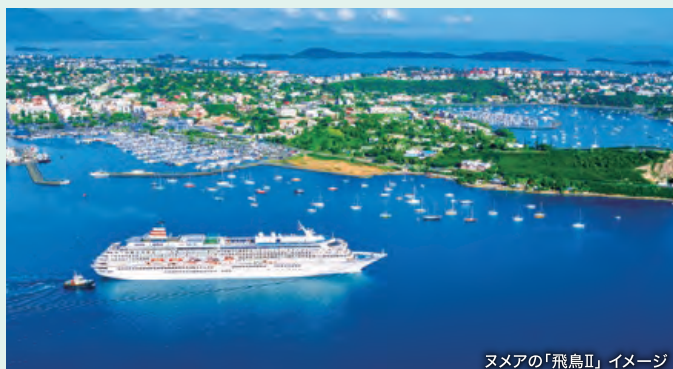
ヌメアの「飛鳥II」イメージ