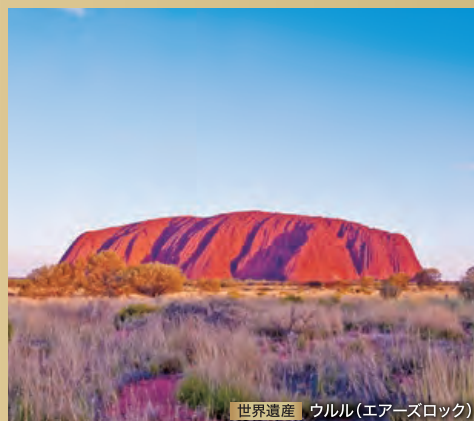
世界遺産 ウルル(エアーズロック)

陸路や空路で内陸観光をお楽しみいただく宿泊を伴うツアーです。なかなか訪れることのできない絶景へご案内します。