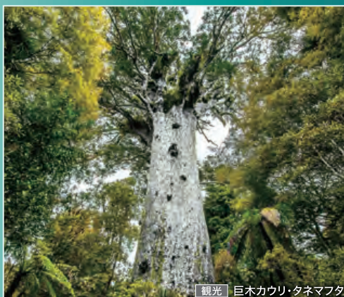
観光 巨木カウリ・タネマフタ