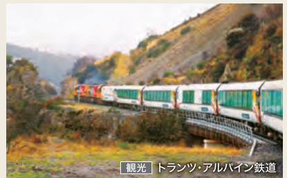
観光 トランツ・アルパイン鉄道

繊細で美しいダニーデン駅からタイエリ溪谷へ向かう観光列車。荒々しい岩肌やダイナミックな丘陵など、豊かな風景の中を進みます。