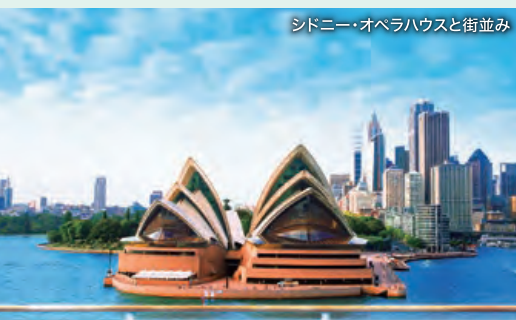
シドニー・オペラハウスと街並み