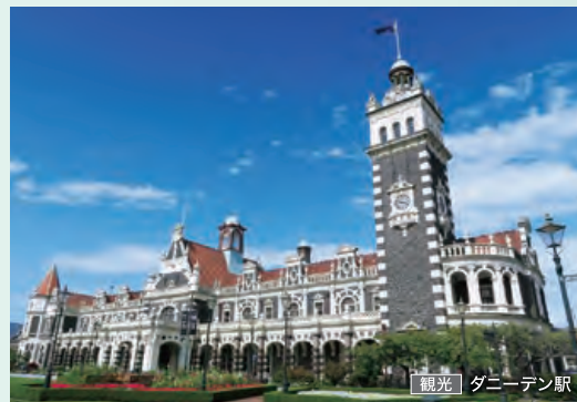
観光 ダニーデン駅

今回訪れるニュージーランドの寄港地はなんと6都市。世界有数の美しさを誇る星空や氷河が削ったフィヨルド、間欠泉、原生林、美しいビーチなど、ここにしかない地球のダイナミズムをご体験いただけます。ヨーロッパの趣ある街並みや列車旅、豊かな食文化も見逃せません。